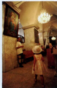
图片左起顺时针：叙利亚沙漠腹地，一个被遗弃的古修道院；大马士革，倭麦叶清真寺；阿勒颇，一个孩子穿行于当地一家亚美尼亚东正教教堂；大马士革街头，一个卖凉茶的中年人。