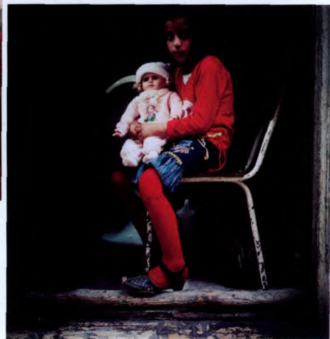
左图：大马士革街头，一个艺人在展示沙雕；右上：一个在叙利亚-伊朗国际列车上的老兵；右下：大马士革城，一个女孩安静地等候家人