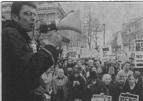
英国公众对 NMD 说“不”