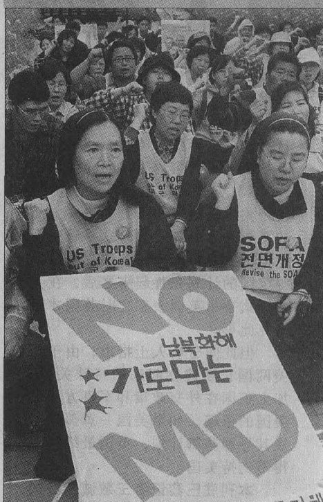
韩国群众反对美国导弹防御系统