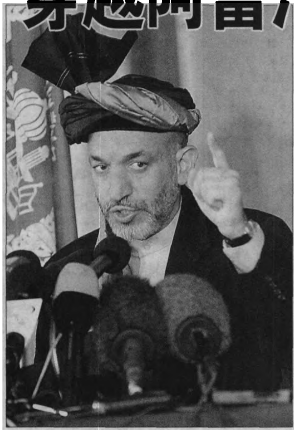
新当选的阿富汗过渡政府领导人卡尔扎伊

白 色的大国民会议帐篷如同一艘巨轮，静静地躺在山岭的环抱之中，黄色的尘土凭借山风之势，在半空中恣意飞扬，遮挡住一双双关注的目光，令人禁不住猜想，这艘白色的巨轮究竟要引领阿富汗驶向何方？