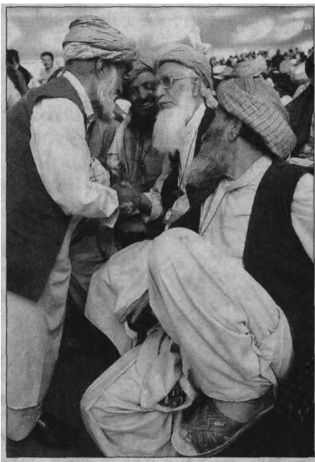
阿富汗大国民会议的代表在一起就重建家园,社会安全和吃饭问题交流意见

除了有关内阁重要职位的变化之外,确定内阁重要职位人选的程序也是前后矛盾。在17日晚的记者