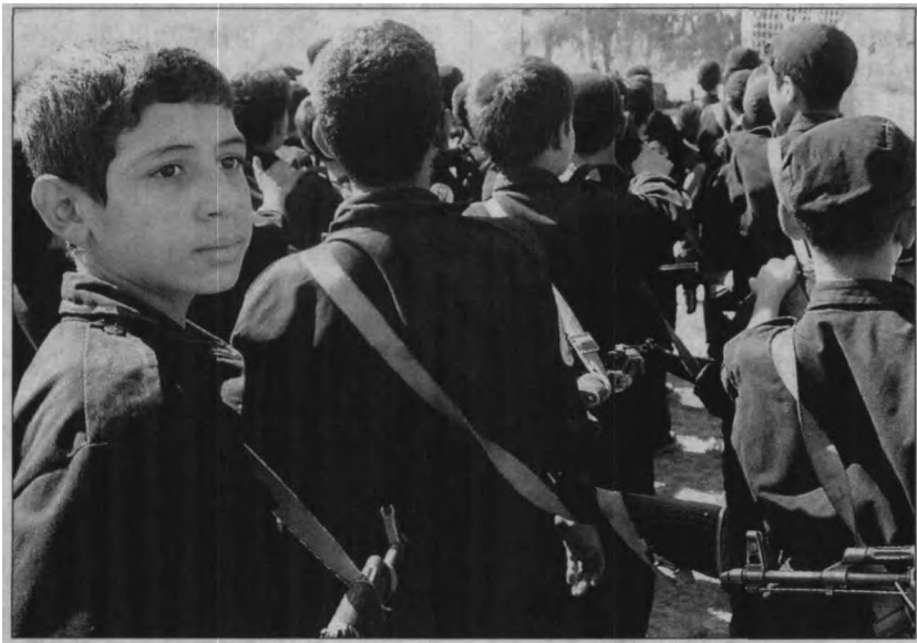
为应对美国的威胁,伊拉克数千志愿者军训

英军从1998年开始进行军事改革,军队规模从30余万减至今日的21万。近年来,英军出动次数明显增多,不仅继续活跃在北约范围内,而且在中东、非洲以及亚太地区也频