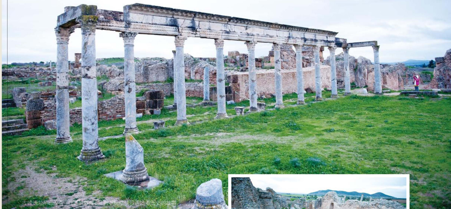
古城遗址早已没有了往日的辉煌，只剩下断壁残垣讲述着历史的故事