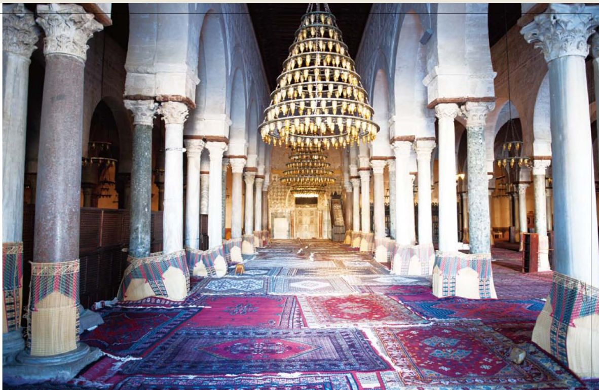
奥克巴大清真寺的礼拜堂