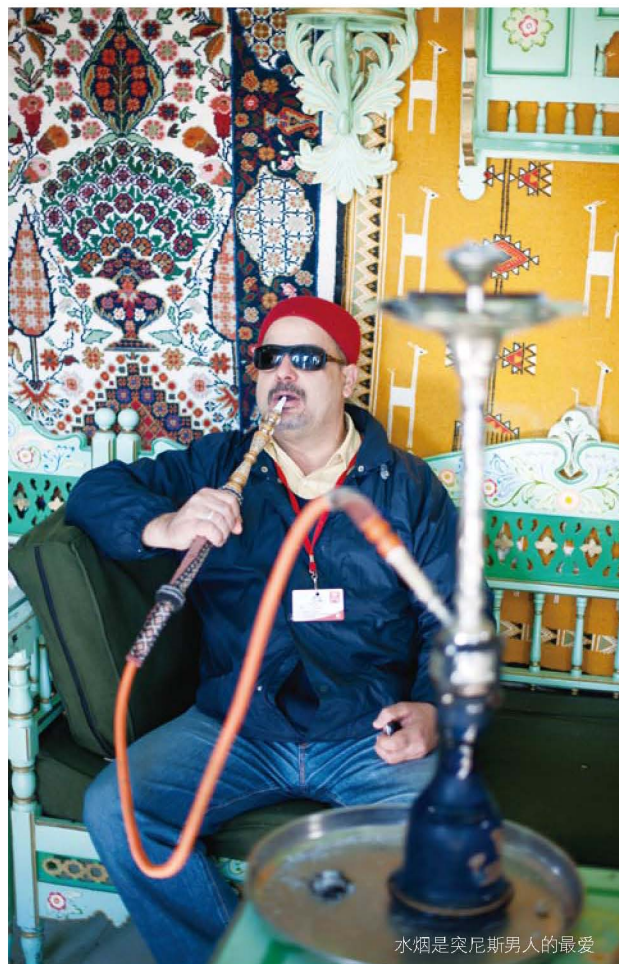
水烟是突尼斯男人的最爱