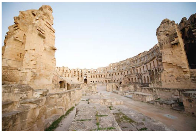
副峦崱害眯娠暮×梭寺朕厝妍伉免嵇蠡簪遭挫眯裸譬

里就像镀了一层金。风起的时候，有些冷，冻僵了拿相机的手。阳光的温暖，风的寒冷，制造了历史，也磨蚀了记忆。我们都是路过，并不曾有半个脚印留下。