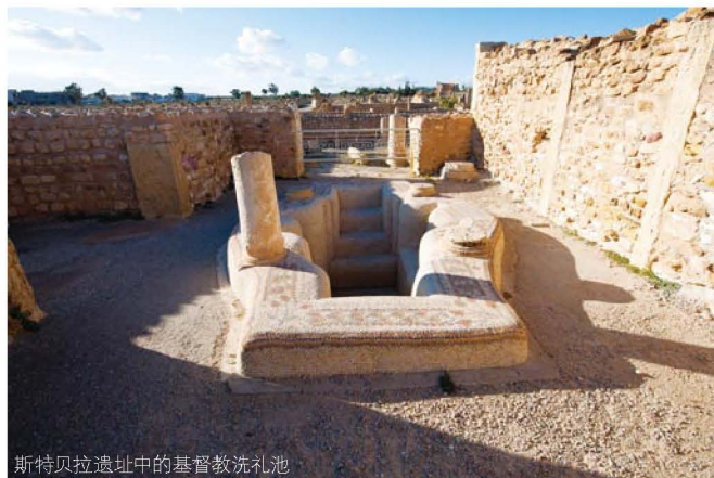
斯特贝拉遗址中的基督教洗礼池