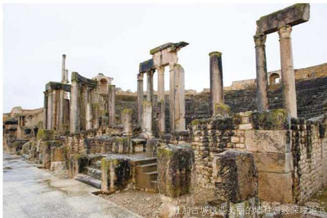
杜加古城这些美丽的墙柱曾经深埋地下