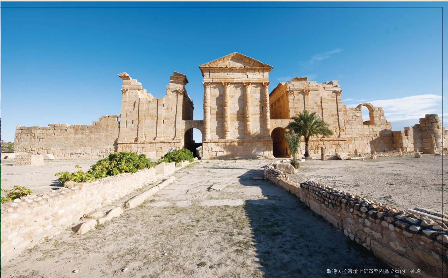
斯特贝拉遗址上仍然坚固矗立着的三神殿