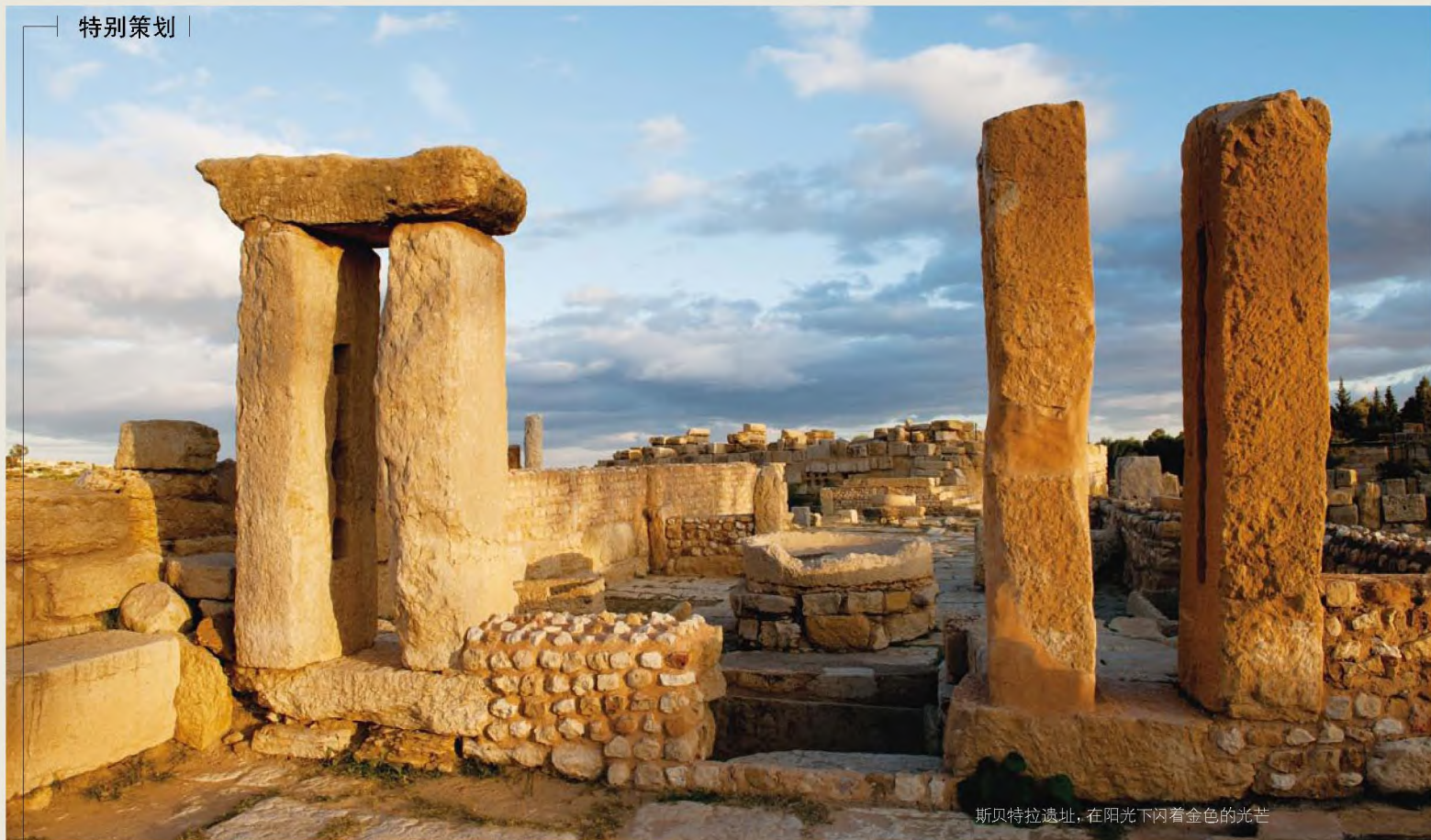
斯贝特拉遗址，在阳光下闪着金色的光芒