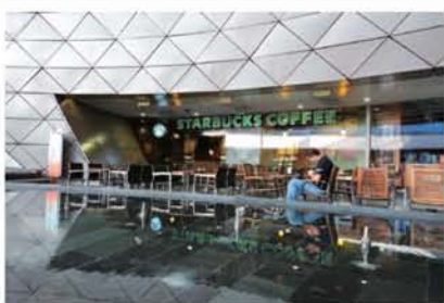
伊斯坦布尔Kanyon购物中心星巴克。

许多中国人默认的土耳其“美食符号”应该是烤肉吧？其实，在土耳其还有更多令人垂涎欲滴的美食等待着你去慢慢发掘。 土耳其百滋美味、会算命咖啡、诱人的果香、迷幻的香料、慵懒的阳光……构成伊斯坦布尔一幅多彩的生活色调，穿行在国际大都市中，享受这份慢调就是一种极致生活，也是人们向往的。