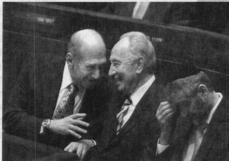
6月13日，佩雷斯（中）在选举过程中与总理奥尔默特交谈

在1988年的大选中，佩雷斯领导的工党仅以一票之差败给利库德集团，佩雷斯在新组成的联合政府里任副总理兼财政部长。在1992年的工党党魁竞选中，复出的拉宾当选为工党主席，佩雷斯又回到了“二把手”的位置上。