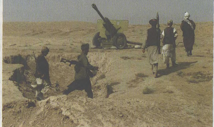
前苏联撤出后,阿富汗的内战已打了十几年。

2. 大力扶植反塔联盟。 在一个陌生的国家作战,没有当地人的协助是难以想象的。如果美国决心彻底扫除在阿富汗的恐怖组织基地,击垮塔利班,则必须建立或扶植一支当地武装力量。从传统上讲,