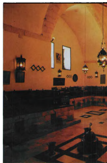
1. 阿联酋迪拜皇家土耳其浴室。穆斯林妇女可以自由地来到定时向她们开放的土耳其浴室，对于母亲们来说，这里也是挑选儿媳的最佳场所 / 2. 也门 As Shukr 浴室。人们统统裹在叫做 Futa 的浴巾里面聊天 / 3. 叙利亚 Yalbouga Al Nasri 浴室 / 4. 伊斯坦布尔 Cemberlitas 浴室

早在中世纪，苏丹们为了取悦民众，大兴公共浴室，巴格达地区在鼎盛时期曾经拥有过 20000 个土耳其浴室。之所以能有如此大的规模，是因为在进清真寺和学校之前，教徒必须先进入土耳其浴室沐浴。不过，现如今，这种源于旧时代的公共浴室正逐渐走向没落。很多土耳其浴室因为经营成本不断上涨而濒临破产。开罗曾经拥有过 365 家土耳其浴室，现在仍然开放使用的只剩下 12 家。