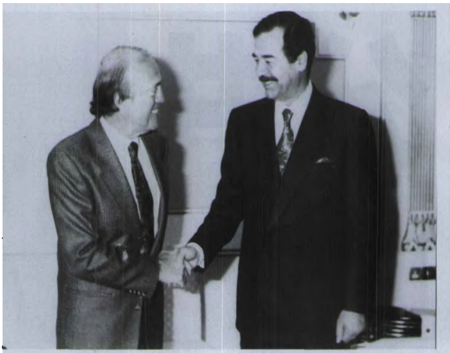
独家专访敌国元首萨达姆

连续实况播报17个小时。轰炸过后，那些信誓旦旦要坚持到最后一刻的CNN工作人员相继撤离，只剩下阿内特和他的两个同事。没有摄影师，没有影像编辑，他们的新闻只能依靠一个四线电话进行声音播报。