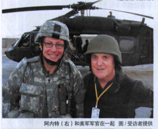
阿内特（右）和美军军官在一起

用。第二天，海军陆战队司令华莱士·格林将军极力否认此事。他们说第21供给纵队根本不存在，并将“蓝钻石战斗”鼓吹为一场打赢了的战役。