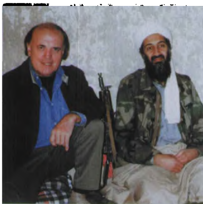
采访美国头号敌人本·拉登

1991年1月17日凌晨，海湾战争打响。CNN当即中止节目插入实况直播，“巴格达呼叫，巴格达呼叫。有事情发生，有