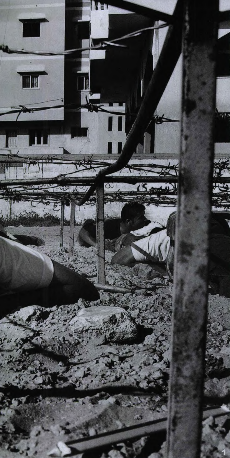
编译 / 王尚

脚下的浮土“噗噗”地被踏起，用木板刻制的AK-47突击步枪被磨得起了毛刺，“欢迎加入圣战队伍”是哈马斯军事夏令营的口号。