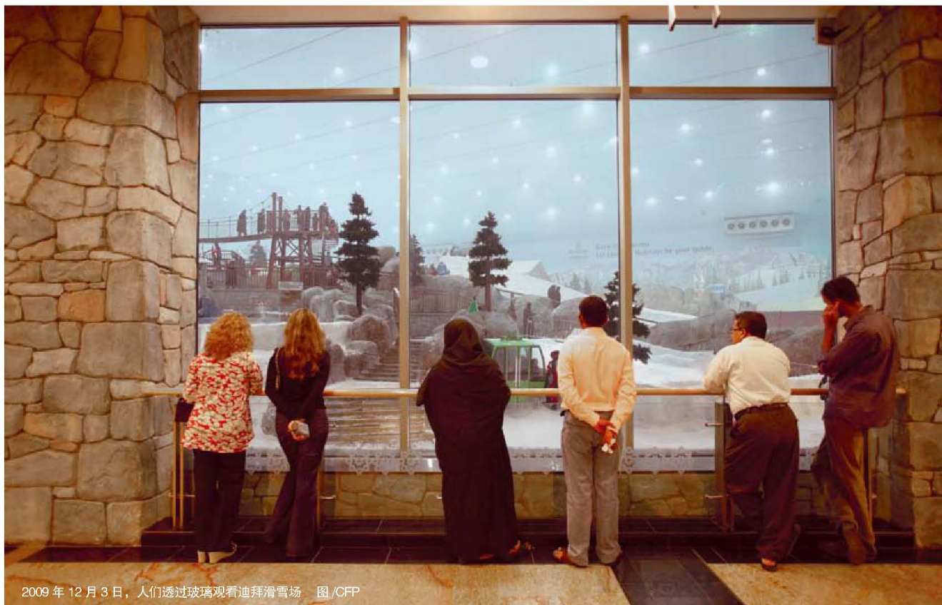
2009 年 12 月 3 日，人们透过玻璃观看迪拜滑雪场