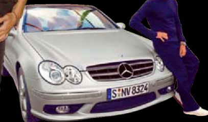
3 时装大师乔治·阿玛尼 在迪拜塔上有一间在建酒店，将 成为阿玛尼酒店全球连锁的旗舰 店。11 月初，由于资金短缺，酒 店已经停建。