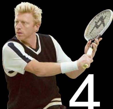
网球明星鲍里斯·贝克尔 鲍里斯·贝克尔塔，位于迪拜商业区 中心位置，楼高 19 层。当初的 2000 多万美元投资如今还剩不足一半。