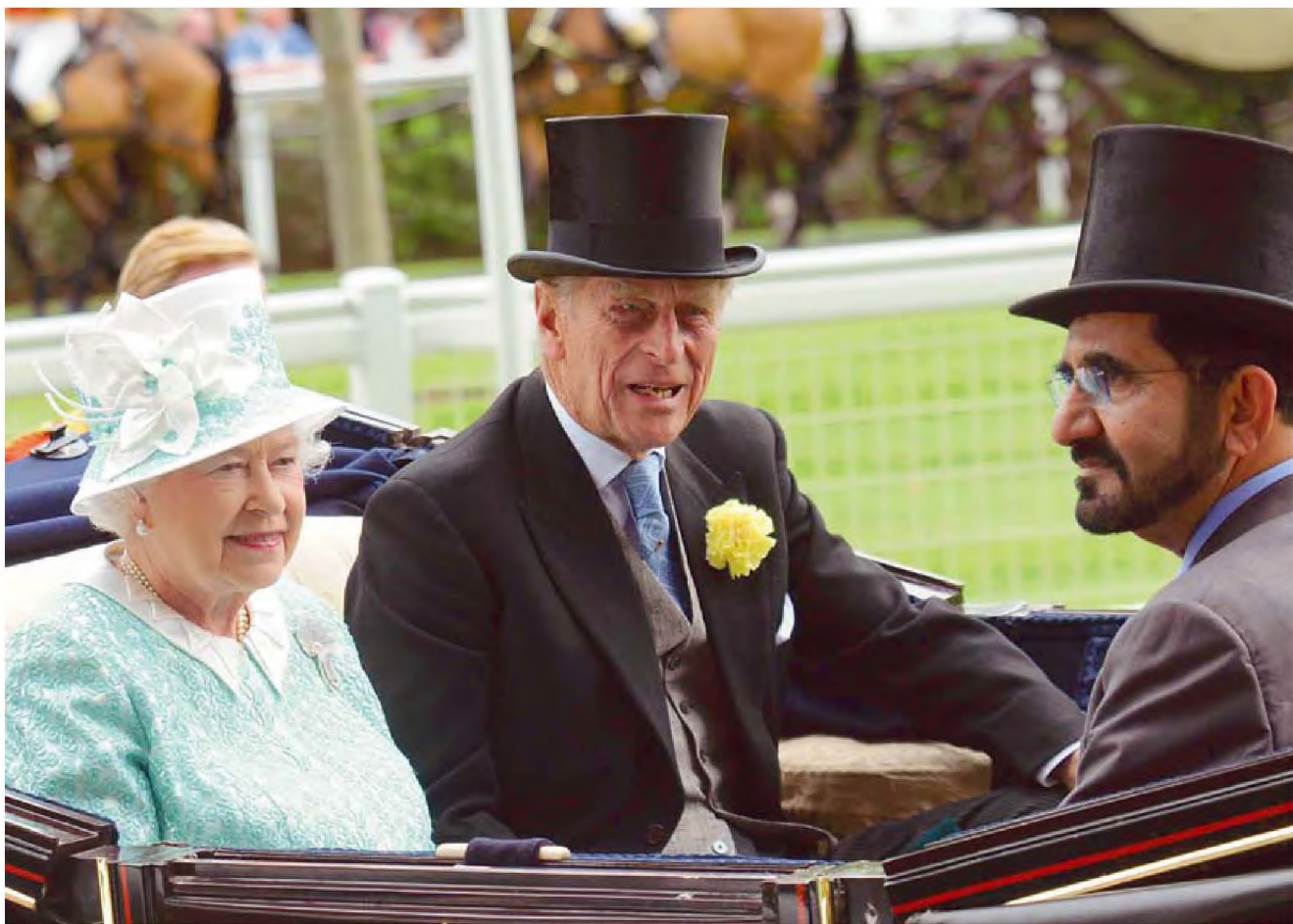
2009年6月18日，迪拜酋长（右）和英国女王伊丽莎白二世及其丈夫菲利普亲王参加英国皇家赛马会

陪伴王室的孩子们在草地上嬉戏的宠物是：蜥蜴、孔雀，苍鹰，还有狮子！狮子在王子哈曼丹的沙发上打盹，白虎在他的手掌中流露出慵懒的神态