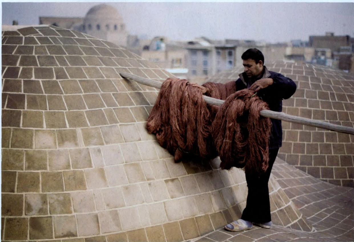
工人在地毯作坊的屋顶晾晒丝线