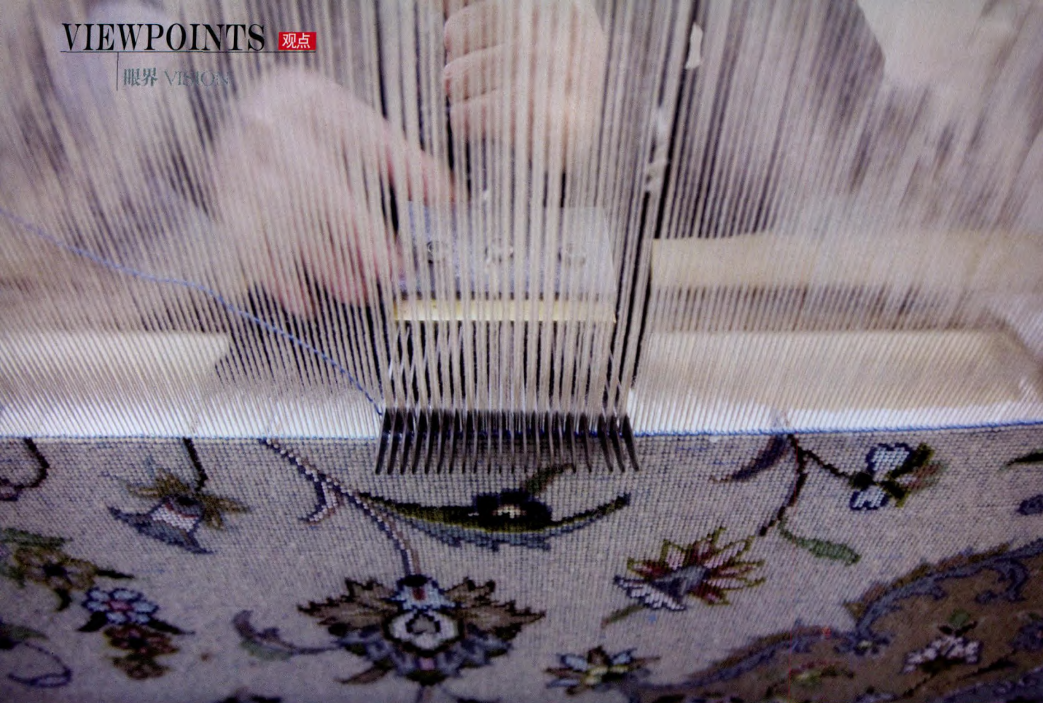
工人在地毯作坊里工作