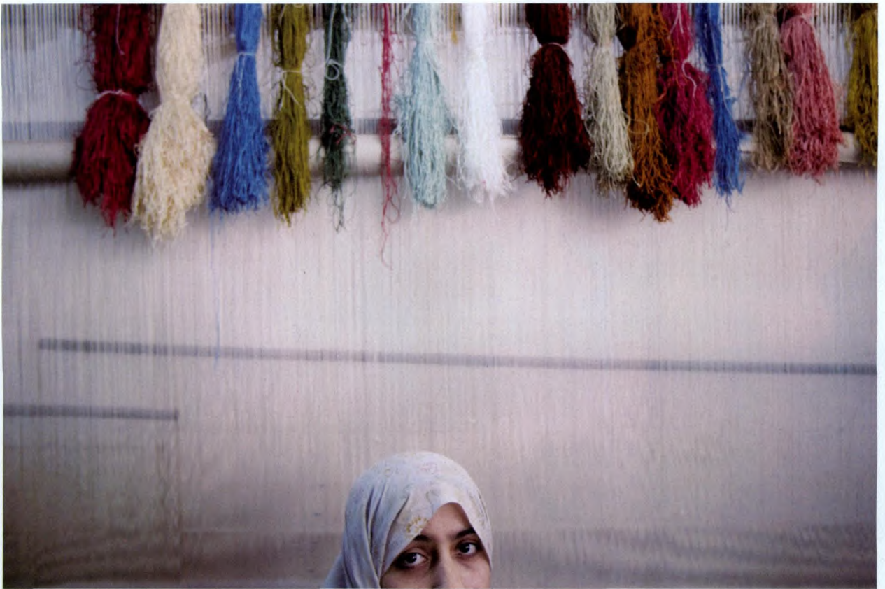
一个工人坐在织布机前