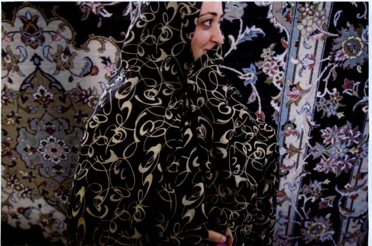
一个妇女站在一幅手织的波斯地毯前