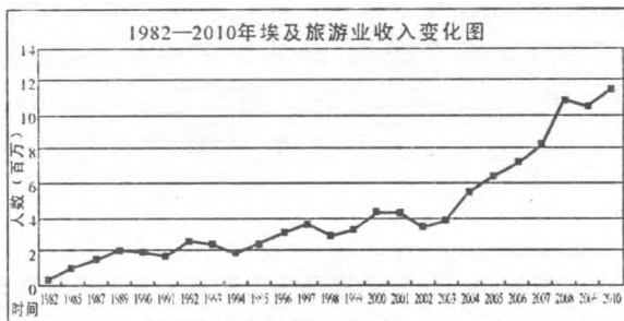
图2 1982—2010年埃及旅游业收入变化 1

恐怖事件使得来埃旅游人数减少,最终造成埃及旅游经济收入的减少。由图2可以清晰的看到:在经历了1993年和1994年频繁的恐怖袭击后,埃及的旅游收入锐减到1.8亿美元,只有1992年的3/4左右;卢克索惨案后的1998年旅游收入也比去年减少了11%,此次惨案直接造成了约7.12亿埃镑的损失。“9·11”恐怖袭击影响了世界各国的旅游业,埃及2001年的旅游收入与2000年持平没有增长,这种影响在2002年体现的更加明显,埃及的旅游收入比2001年还减少了21%。2004年塔巴爆炸案使得来埃及旅游的外国游客人数减少了20万人,旅游业因此损失了近两亿美元的收入。