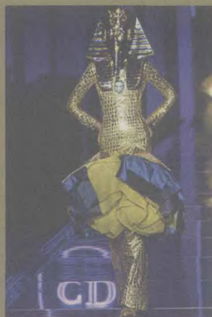
John Galliano 以“埃及艳后”为主题担纲设计的Dior时装