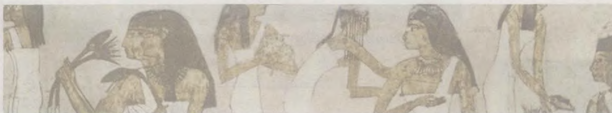
Veronese 设计作品： 手工彩绘的“埃及艳后” 珠宝柜