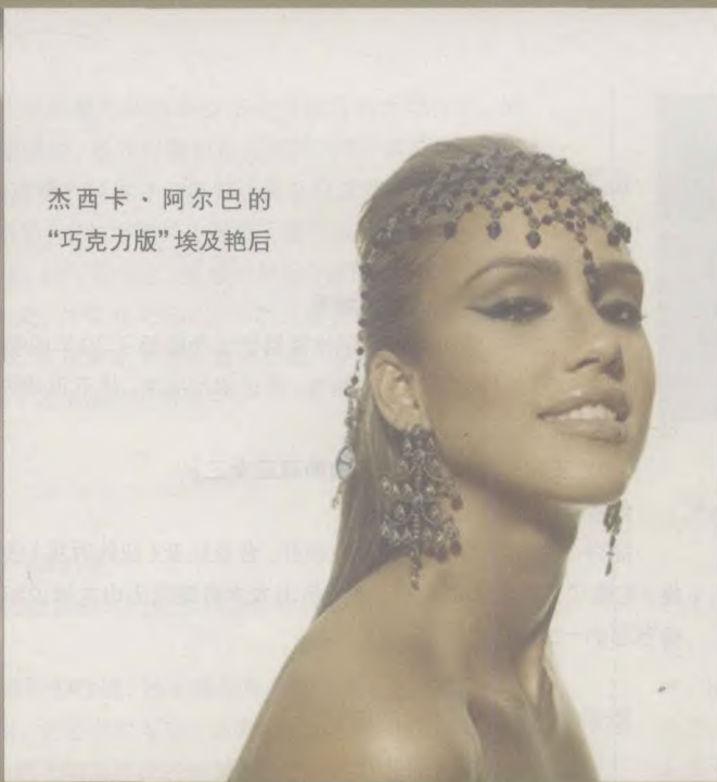
杰西卡·阿尔巴的 “巧克力版”埃及艳后