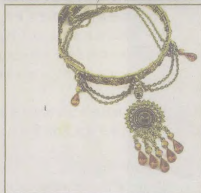
各种以“埃及艳后” 命名的精美饰品