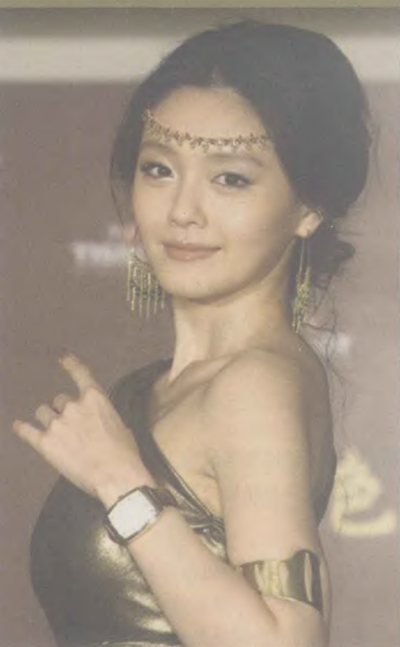
大S徐熙媛出席代言活动时的埃及 艳后造型惊艳全场