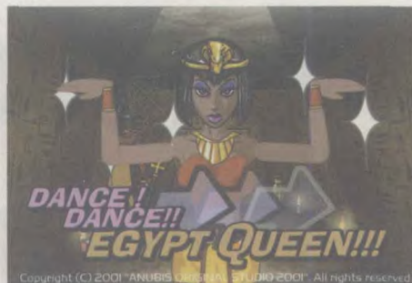
以“埃及艳后”为原型人物设计的各款电玩