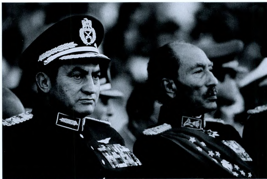
穆巴拉克的工作能力得到时任总统萨达特的赏识。“我之所以选穆巴拉克作为我的副手,因为他是飞行员,是空军司令,是十月战争的指挥者之一……还因为他是我们祖国人民的灵魂的代表,我希望他走上国家最高领导岗位。”萨达特评价说。图为1981年10月6日,时任埃及总统萨达特与时任副总统穆巴拉克参加“十月战争”8周年阅兵典礼。

成就:获得有“杰出英雄”的称号和埃及共和国勋章;当今阿以和谈的重要调停人;1993年9月,被国际法学家组织授予和平奖;1987年、1993年、1999年、2005年4次连任埃及总统。