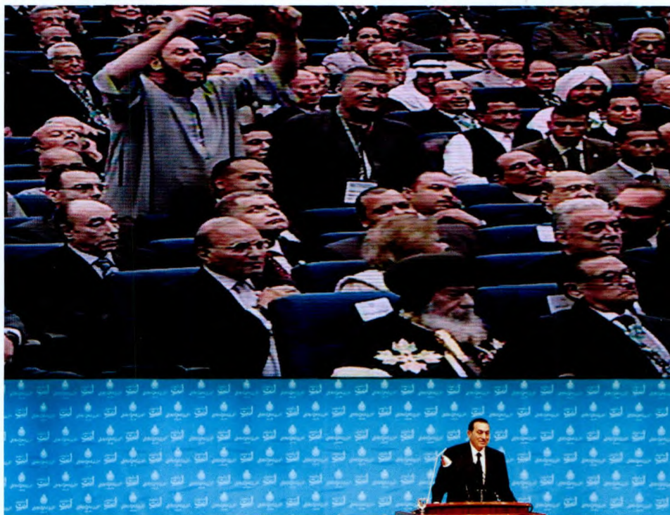
随着埃及经济遭遇 2009 年全球金融危机,埃及国内贪腐严重,失业率高企,物价飞涨等问题激化了政治矛盾。穆巴拉克推行威权政治 30 年,对其长期执政不满的不仅仅是平民百姓,执政精英及军队高层也担心穆巴拉克把权位直接传予儿子,绕过执政党及军方高层。图为 2009 年 10 月 31 日,穆巴拉克在执政党大会演讲时遭遇质问

美国积极在埃及寻找新的代理人,明天党的主席努尔让美国人眼前一亮。为了能够让努尔参加总统大选,美国对穆巴拉克政府实施了空前的压力。为此,埃及政府作出了妥协性的回应。经穆巴拉克建议,埃及议会通过决议,同意在总