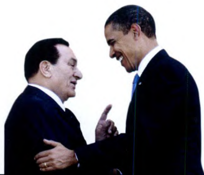
2009 年 8 月 18 日，美国总统奥巴马在位于华盛顿的白宫椭圆办公室会见来访的埃及总统穆巴拉克