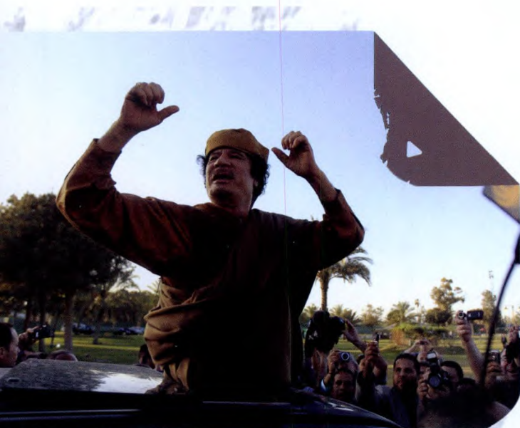
奥马尔·穆阿迈尔·卡扎菲

在“9·11”恐怖袭击事件过去近 10 年之后,美国总统奥巴马于 2011 年当地时间 5 月 1 日发表全国电视演讲,宣布“基地”组织领导人奥萨马·本·拉丹已被打死,并对其尸体进行了确认。巴基斯坦外交部也于 2 日中午确认“基地”领导人本·拉丹死亡的消息,巴外交部在公告说,拉丹在巴基斯坦时间 2 日凌晨美国特种部队在巴基斯坦北部阿巴塔巴德实施的突击行动中死亡。