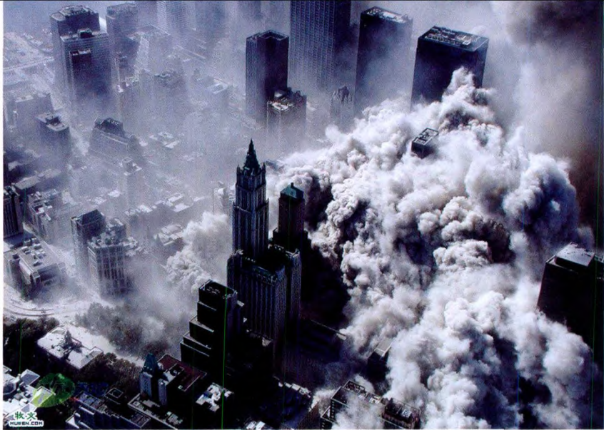
2001 年，美国纽约世贸中心倒塌时的情景