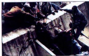
Nairobi & Dar es Salaam bombings, 1998 220 killed and 5,000 wounded