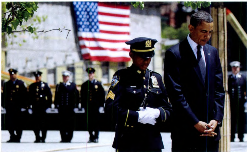
当地时间 2011 年 5 月 5 日，美国总统奥巴马首次来到纽约世贸中心遗址，在这里，奥巴马向 10 年前在“9·11”事件中逝去的近 3000 生命敬献花圈