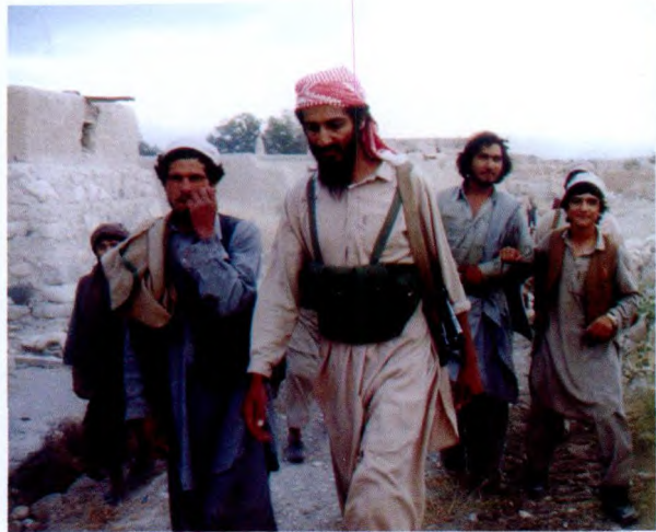
1988 年,阿富汗东部城市贾拉拉巴德,本·拉丹和战友们在一起

中国现代国际关系研究院反恐中心主任李伟认为,海湾战争是拉丹开始反美的肇始,“这件事对他的刺激最大。拉丹自认为代表贫穷和正义的穆斯林,其他欢迎美军进驻的阿拉伯政府都已经异化,成了美国的帮凶。海湾战争爆发后,拉丹认为美国已取代前