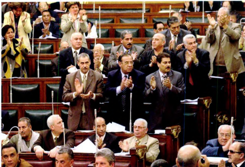
由于国内外的双重压力，已连续执政 24 年的穆巴拉克在 2005 年要求埃及议会修改宪法，将总统选举从一名总统候选人改为由多党提名的多位候选人，但未触及“领导终身制”这一规定。最终，穆巴拉克在这场埃及历史上首次实行“差额选举”的总统选举中赢得压倒性胜利，第 5 次当选埃及总统。图为 2005 年 2 月 26 日，穆巴拉克在议会宣布修宪，立法委员起立鼓掌