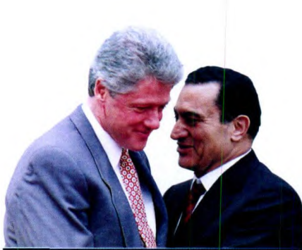
1993 年 4 月 6 日，穆巴拉克在白宫与当时的美国总统比尔·克林顿道别

萨达姆于 1990 年 8 月入侵科威特，穆巴拉克对此坚决反对。他准确地揣摩出美国的利益所在和意图，派出 4.5 万人的军队，加入美国带领的驱逐伊拉克部队的联军，人数为阿拉伯世界中最。埃及在阿拉伯世界的“带头”作用，客观上让美国师出有名。对此，美国深表感激。虽然埃及士兵没有直接参战，却获得美国