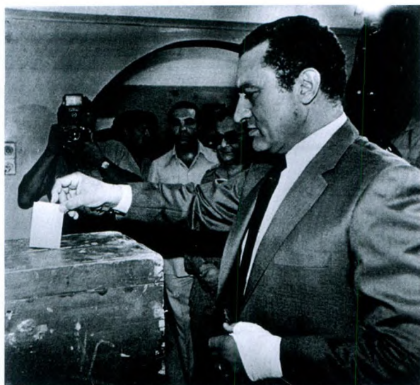
萨达特遇刺后，穆巴拉克成了众望所归的中心人物。最终，穆巴拉克以 98% 的选票当选为埃及第 4 任总统。图为 1981 年 10 月 13 日，穆巴拉克在投票