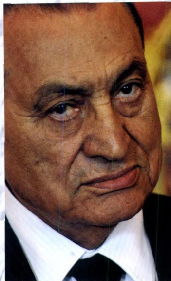
穆罕默德·胡斯尼·穆巴拉克