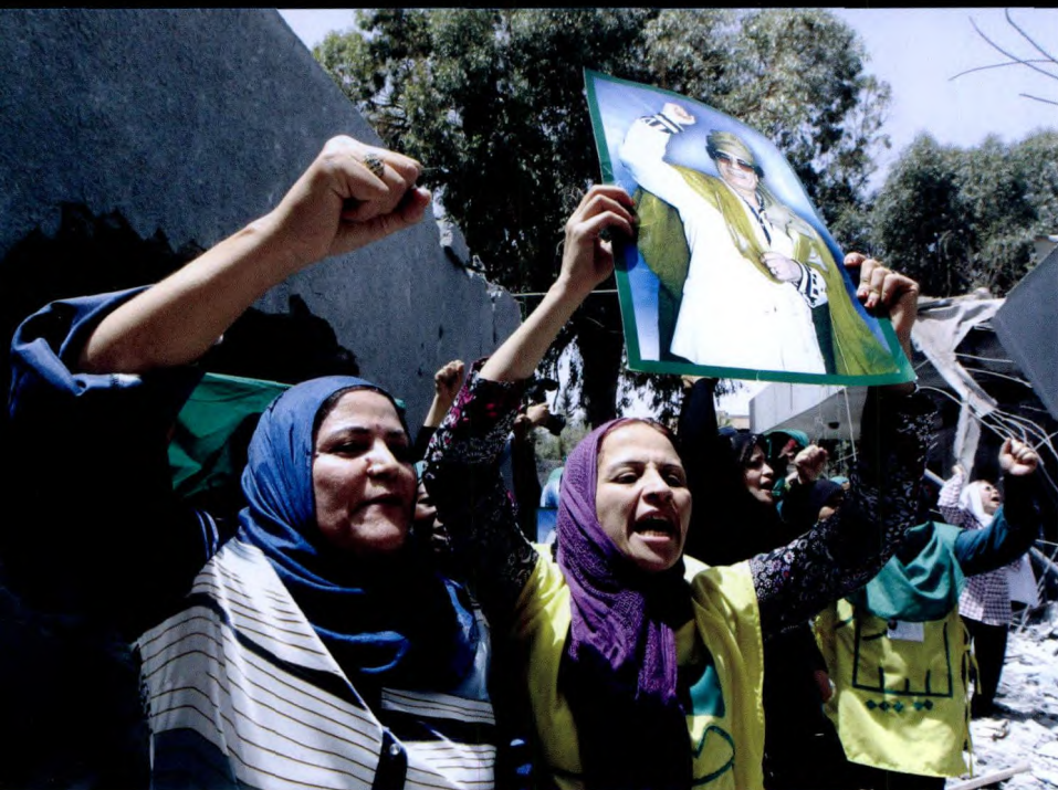
卡扎菲的支持者们在被北约炸毁的卡扎菲住所前集会示威