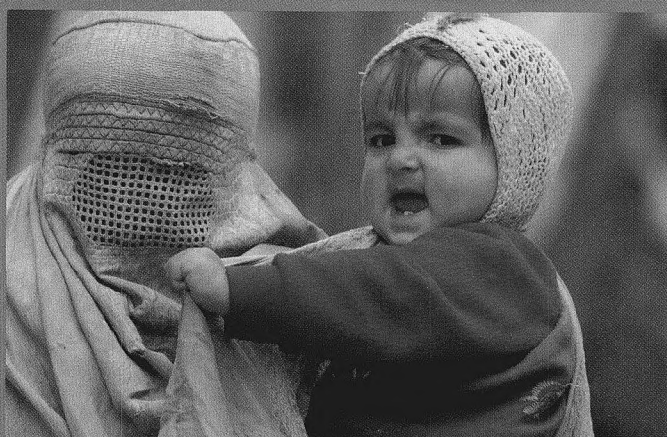
11月10日，在首都喀布尔街头一角，一位在母亲怀抱中的小女孩试图挣脱母亲包裹在她身上的“波卡”。