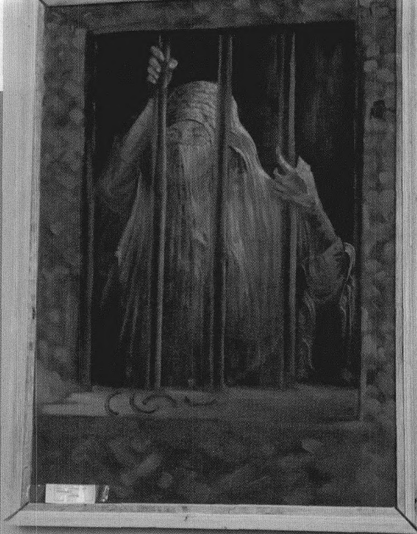
2002年9月17日，一位脱去“波卡”的阿富汗妇女在喀布尔新闻与文化中心欣赏一幅描绘阿富汗在“塔利班”政权统治下，阿富汗妇女在人身和精神上受到禁锢的油画作品《双重桎梏》(Two Jails)。

在穆斯林的世界里，成年女子若要在公共场合出现，必须披戴黑色或白色的波卡遮挡面部和身体，只露眼睛和双足。在阿富汗，披戴面纱的传统被推向了封闭的极至，阿富汗的女人们经历着闭塞的“波卡”时代。