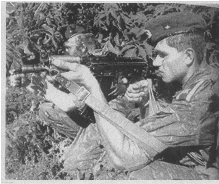
▲苏联空降兵特别行动队队员

俄罗斯特种作战部队是在苏联解体之后，于1992年5月7日在俄罗斯武装力量组建的同时诞生的，它源于苏联的“军中之军”——苏联特种作战部队，并且完全继承了苏联特种作战部队的衣钵。所以，要想了解俄罗斯特种作战部队，只要了解苏联特种部队即可见一斑。