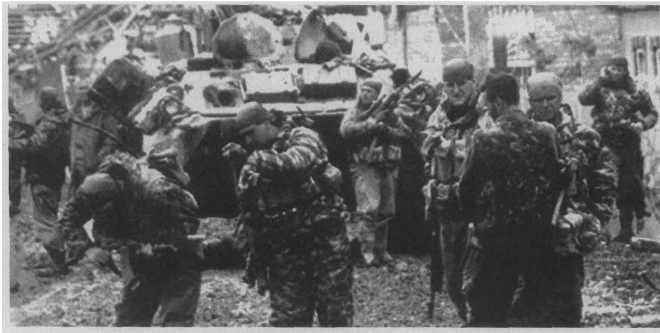
图1 刚刚撤出战斗的特种部队队员

隆隆”的爆破声，几颗凝固汽油弹燃起了熊熊大火。队员们立即从背囊中取出防护服，仅几秒钟便穿着完毕，然后端着步枪冲进了“呼呼”作响的大火之中，冲出火海后，眼前又是通往“城镇”的低层铁丝网，当他们匍匐穿过铁丝网时，脸上、身上、手上已是伤痕累累。突然，天空响起了飞机的引擎声，几架战斗机从低空掠过，对准一幢高层楼房投下几枚重磅炸弹，烈火顿时吞噬了整幢楼房。队员们冲到楼前，攀上窗台，像猴子一样迅速登上30