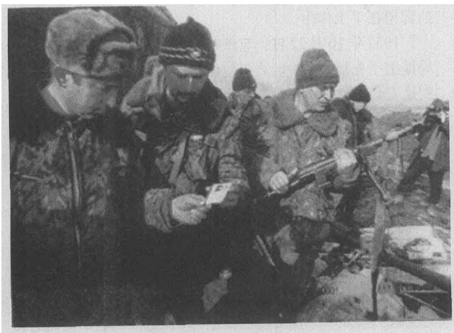
图2 特种部队在搜索现场