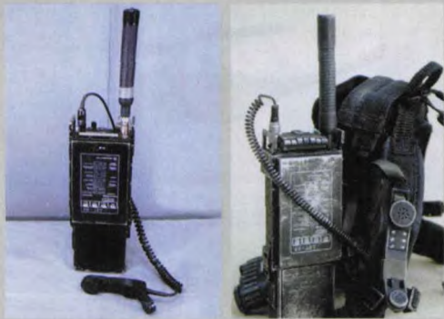
摩托罗拉公司生产的LST-5B/C SATCOM (轻型卫星终端) 实物 (右) 与兵人模型 (左) 对比