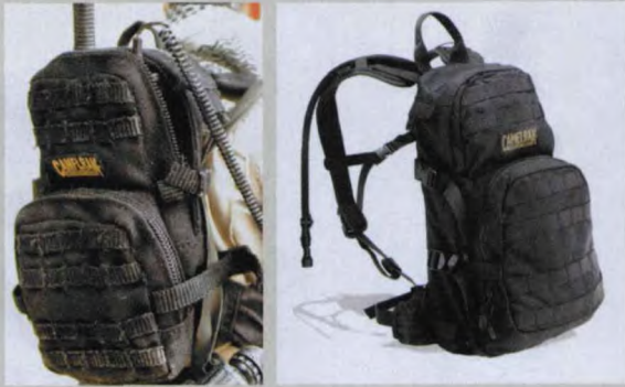
带有驼峰净水系统的多功能背包实物 (右) 与兵人模型 (左) 对比