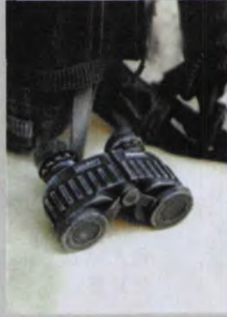
享誉世界的德国斯坦因军用望远镜

了中情局人员在当地入乡随俗的工作方式。世人对于他们身着阿富汗长袍的模样或许并不陌生，因为从对抗苏联入侵阿富汗开始，他们就是以这样的服饰深入阿富汗腹地完成支援当时反苏地方游击势力的，而如今只不过依旧穿着长袍来寻觅破坏美国国家安全利益的恐怖分子。