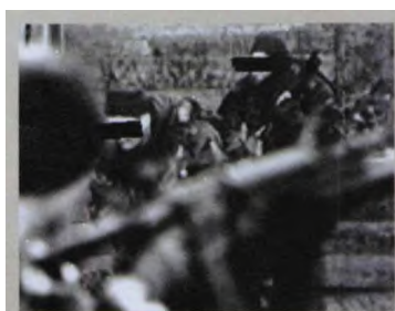
1990年代中情局SAS人员的行动资料图片

这个特遣部门内聚集了美国海军特种部队的精英人士：如上文提到的海豹突击队、海军陆战队强侦单位、海军特种作战发展群。他们更强调执行两栖任务的训练，例如在敌方海岸线完成人质劫持事件的处理等。