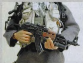
逼真的Tantal wz.88突击步枪和GP-25榴弹发射器模型