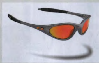
▲与兵人佩戴太阳眼镜款式相似的实物图片