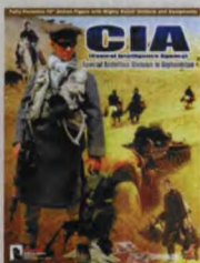
兵人以及包装盒封面