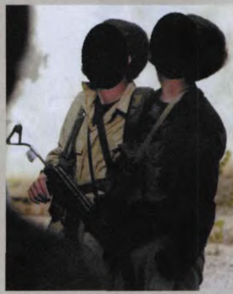
中情局SAS人员在阿富汗使用Tantal wz. 88突击步枪资料图片