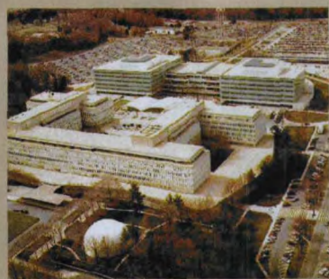
坐落于弗吉尼亚州兰利的美国中央情报局主楼