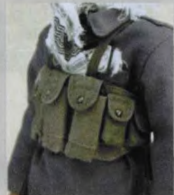
AK专用的弹匣胸挂模型