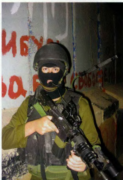
在巴以隔离墙进行巡逻的狮崽步兵突击旅队员，他的M4卡宾枪上加装了多用途反射式瞄具