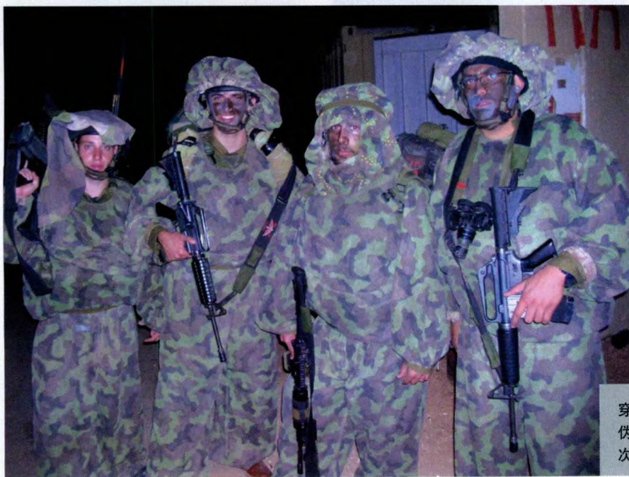
穿着以色列特制迷彩服和“Mitznefet”型头部伪装的狮崽步兵突击旅队员正在准备执行一次夜间侦察任务

狮崽步兵突击旅的这些训练是对以色列国防军标准训练的一种延伸和发展。由于以色列地域复杂，城市作战的战术就更有别于一般传统城市攻坚战术。以色列部队必须有针对性地使用非致命性武器对日常的骚乱、示威以及挑衅行为进行控制，而对于有组织的恐怖行动，则必须进行精确的打击。这些打击行动往