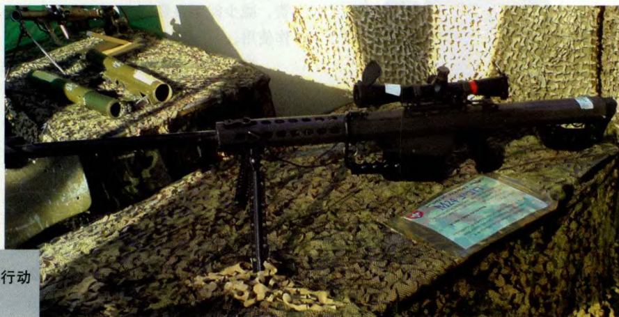
M82A1 狙击步枪是狮崽步兵突击旅针对特种行动配备的专用大口径狙击武器

在6支步兵突击营中，较为著名的是纳森营（纳森是犹太教义中一位王子的名称——编者注）和尼萨耶荷达营。纳森营是1990年代末活跃在以色列西海岸地区的一支重要军事单位，该营的前身是1998年成立的纳森连，擅长城市特种作