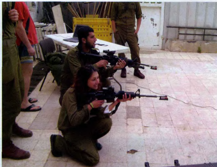
在狮崽步兵突击旅这样的精英部队中同样有一定数量的女兵服役，她们虽然在任务强度上会低于普通男性士兵，但已成为以色列国防军的一道特别的风景区

沃尔 (Tavor) 突击步枪存在一定的不足，没有得到实战部队的肯定和信赖，以色列国防部不得不重新采购美国柯尔特公司生产的 M4 卡宾枪作为狮崽步兵突击旅的主要单兵武器。为了提高枪械性能，还加装了国际科技激光公司生产的多用途反射式瞄具，该瞄具可以安装