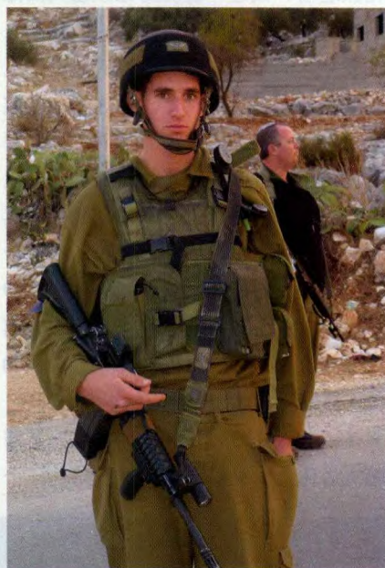
狮崽步兵突击旅队员正在西海岸城市的路道上进行巡逻检查

缝制和设计思路较为简约实用，缝制要求非常严格，使用和耐受强度较大。战术挂具在人体结构设计上体现了较为宽大的受力支撑结构，可以满足长距离大负重的使用要求。装具的携弹量也按照以色列轻步兵长距离任务弹药携行量进行设计，可以提供充裕的携弹空间和容量。