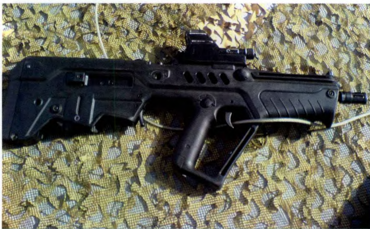
以色列研制的塔沃尔突击步枪并没有得到本国军方的青睐，它只是包括狮崽步兵突击旅在内的很多部队进行训练的武器之一