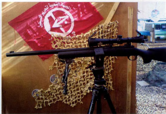
加装在钢制摄影三脚架上的M24狙击步枪，其出色的城市作战效果得到了各国狙击手的肯定

战和城市步兵战术。在并入狮崽步兵突击旅之前，该连一直驻防在以色列西海岸城市图勒凯尔姆，保护当地以色列人的安全，同时预防巴勒斯坦武装派别人员制造自杀性爆炸事件。该连的座右铭是“纳森，永远的先锋”。鉴于该连地理位置的重要性和对城市作战的丰富实战经验，以色列国防部于2000年前后将其提升为营级单位，并随后并入了狮崽步兵突击旅。而尼萨耶荷达营成立于1999年，成立之初仅有30多名人员组成，到2006年初，该营的人员编制超过了1000人。该营的主要作战地域位于约旦河谷，其重点部署地点位于约旦河谷的巴勒斯坦人居住的城市和难民营。该营包括2个