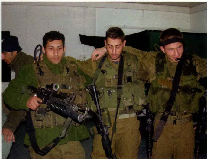
狮崽步兵突击旅队员正在进行祈祷，以色列的军队建设很大程度上依靠信仰的凝聚力

往要运用特种作战的相关战术，包括房间搜索和对指定区域建筑的攻坚作战等。而有些时候又要出于政治目的“围而不打”。这种战术行动受到城市环境的限制，加之巴勒斯坦激进组织化整为零的躲避方式，因此既要求步兵突击旅在战术上充分发挥个人技能，又要求实现步兵班组的协同火力配合。同时为了更有针对性地进行城市作战，狮崽步兵突击旅中专门成立了小规模的反游击作战排和特种作战部队。这类部队具有全天候作战能力，并且接受过以色列国防军特种单位作战训练，具有比较系统的近距离作战技能。而针对开阔地域的协同作战，狮崽步兵突击旅同样注重相关的战术总结和训练内容。该旅可以协同相应防区的装甲部队和步兵部队开展区域性的作战，也可以旅为单位开展自主的军事行动。该旅还配备有专业的特种侦察渗透部队，具有全地形野外渗透侦察技巧，可以为区域作战提供相应的情报和必要的信息。