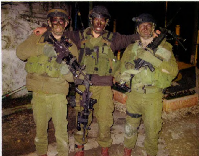
进行定点清剿行动的狮崽步兵突击旅队员，图中右侧的队员手持以色列军事工业公司制造的内格夫轻机枪