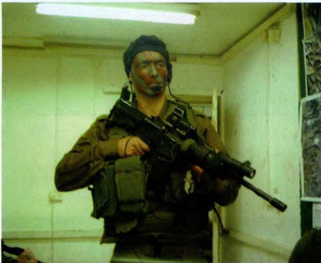
整装待发的狮崽步兵突击旅队员，他穿着以色列特种部队专用的侦察战术背心