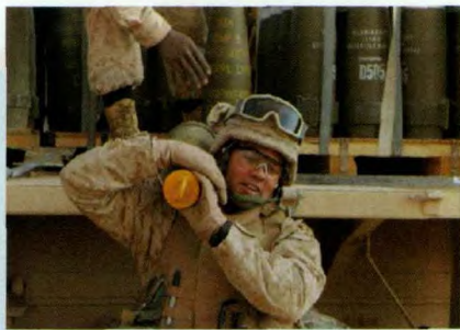
相比于巴方的武装力量,以军弹药充足

4月13日以后,以军主要行动是对巴控制区各村庄的清剿,抓捕以方通缉的巴抵抗运动的重要骨干。4月15日,以军中部军区217侦察营和500装甲旅侦察连在拉马拉附近抓获“法塔赫”西岸地区书记巴尔古提,成为以军在此阶段行动中最重要成果。