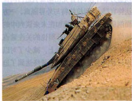
以方性能先进的坦克令巴武装力量望尘莫及

另外,面对军事实力极其弱小的巴勒斯坦,以军动员了坦克、武装直升机等重型装备,出动4万余名正规部队,以重兵压境的态势对巴方造成极大的心理威慑。在进占拉马拉过程中,以军对抵抗或拒捕的巴方武装人员毫不手软,击毙巴方武装人员的场面经新闻媒体播出后,对巴方的抵抗意志造成了巨大冲击。