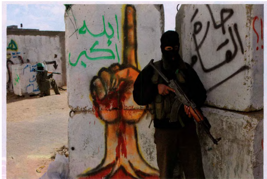
2007年12月20日,两名巴勒斯坦武装人员在加沙中部一个难民营准备应对以色列军队的袭击行动。巴勒斯坦安全部门官员20日说,以色列军队当天在加沙中部地区的军事行动中,打死至少4名巴武装人员

杰宁地区 该区作战由“伊甸”预备役装甲师负责指挥,参战兵力包括2个预备役机步旅及该师所属部分坦克分队(约