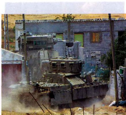
巷战中以军的“移动堡垒”

由于西岸巴城镇建设无统一规划,地形地貌变化大。以军在情报收集上广泛使用无人机进行航测和侦察,传统的作战地图基本被航空照片所替代。考虑到城市巷战的特殊性,以军在实施侦察时,不仅要查明敌方的具体位置、防御部署,还要了解巴方实施巷战的防御方法以及通往城市大街小巷的路线和其他具体的地形资料,特别是通向掩体、具有战术价值的建筑物、制高点等道路的资料。以军还将无人机用于战术侦察,对直升机预降点和难民营等进行实时侦察。同时,以军在作战行动中还广泛使用了以安全总局的人力情报网,较好地弥补了常规的侦察手段在低强度冲突和城镇地形条件下的缺陷。