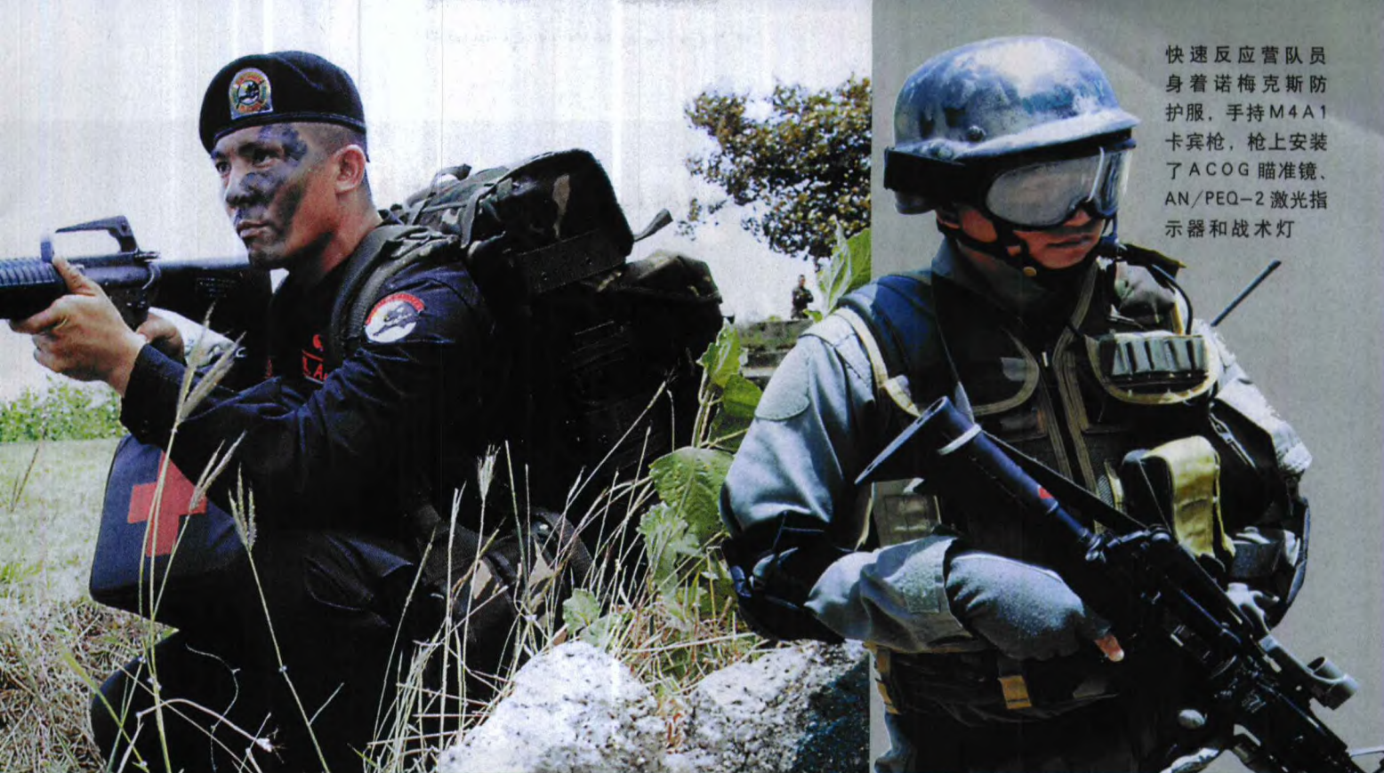
快速反应营队员 身着诺梅克斯防 护服，手持M4A1 卡宾枪，枪上安装 了ACOG瞄准镜、 AN/PEQ-2激光指 示器和战术灯