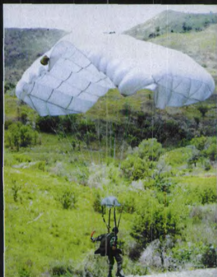
MC-4军用降落伞在美军特种部队中装备广泛,不仅可完成高跳低开(HALO)、高跳高开(HAHO)等基本战术动作,还可在一定程度上控制降落伞降落的方向和飞行的距离,选择适当的落点。菲律宾军队中仅有特种部队少量装备。而菲律宾军队的标准装备是MC-1C降落伞,T-10R降落伞。图中这名菲律宾士兵正控制MC-4降落伞缓缓地下降

菲律宾特种部队队员虽然进行了伞降训练及考核,但要保持这种伞降能力更加重要,图中特种空降团队员准备从赛斯纳172飞机上进行伞降