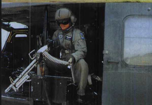
图中的UH-1H通用直升机属于菲律宾空军(PAF)“针刺”战术直升机中队,该中队驻扎在首都马尼拉的比利亚莫尔(Villamor)空军基地。直升机一般用于兵力的快速部署(通过绳降或者伞降将兵力投送至战斗区域),也可执行战斗支援任务。每架直升机可搭乘13名士兵。直升机两侧的舱门处均可安装一挺M60D 7.62mm通用机枪

第一侦察突击团的标准侦察突击行动小组一般由7人组成。图为兼职做队医的侦察突击队员