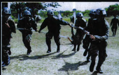
空降兵们正拖着系在队友身上的降落伞绳向 前跑，以便学会如何在伞降着陆时调整步伐