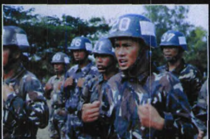
报考者在特种部队学校接受训练。他们身穿标准的菲律宾军服,头盔侧面记录了他们已经接受训练的周数