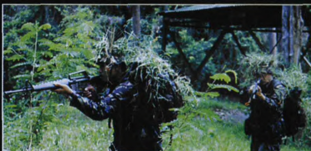
手持M16A1突击步枪的特种部队队员正在进行野外搜索训练