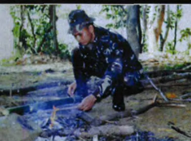
特种部队队员必须熟练掌握野外 生存技巧，图为野外生存训练中 队员正在做竹筒饭