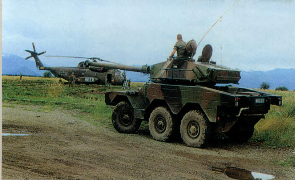
伞兵部队装备的ERC-90 Sagaie型装甲车，这种车辆无法随部队一起伞降，只能通过空运配备给部署后的伞兵部队。尽管ERC-90装甲车无法与现代各种主战坦克一争高低，但其仍可摧毁一些第三世界国家广泛使用的、老式的坦克，比如T-55、T-62系列坦克等。图中远处准备吊载ERC-90装甲车的直升机为德国空军的CH-53型直升机