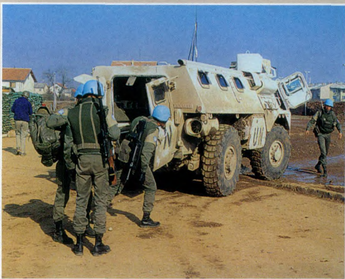
法国为联合国在波斯尼亚的维和行动提供了大量兵员和支持，其维和任务也多由第11空降师来担负。图为第2外籍伞兵团的士兵正准备将一辆VBL轻型装甲车运往萨拉热窝机场

务时，第11空降师主要在法国总参谋部的直接指挥下行动；而当被派驻与法国签署有双边防务协议的海外国家时，比如中非、加蓬、乍得、波斯湾的一些国家以及卢旺达等国时，第11空降师可通过法国在安蒂亚、印度洋和太平洋上的基地为营地，对需要干涉的国家进行军事力量投射。