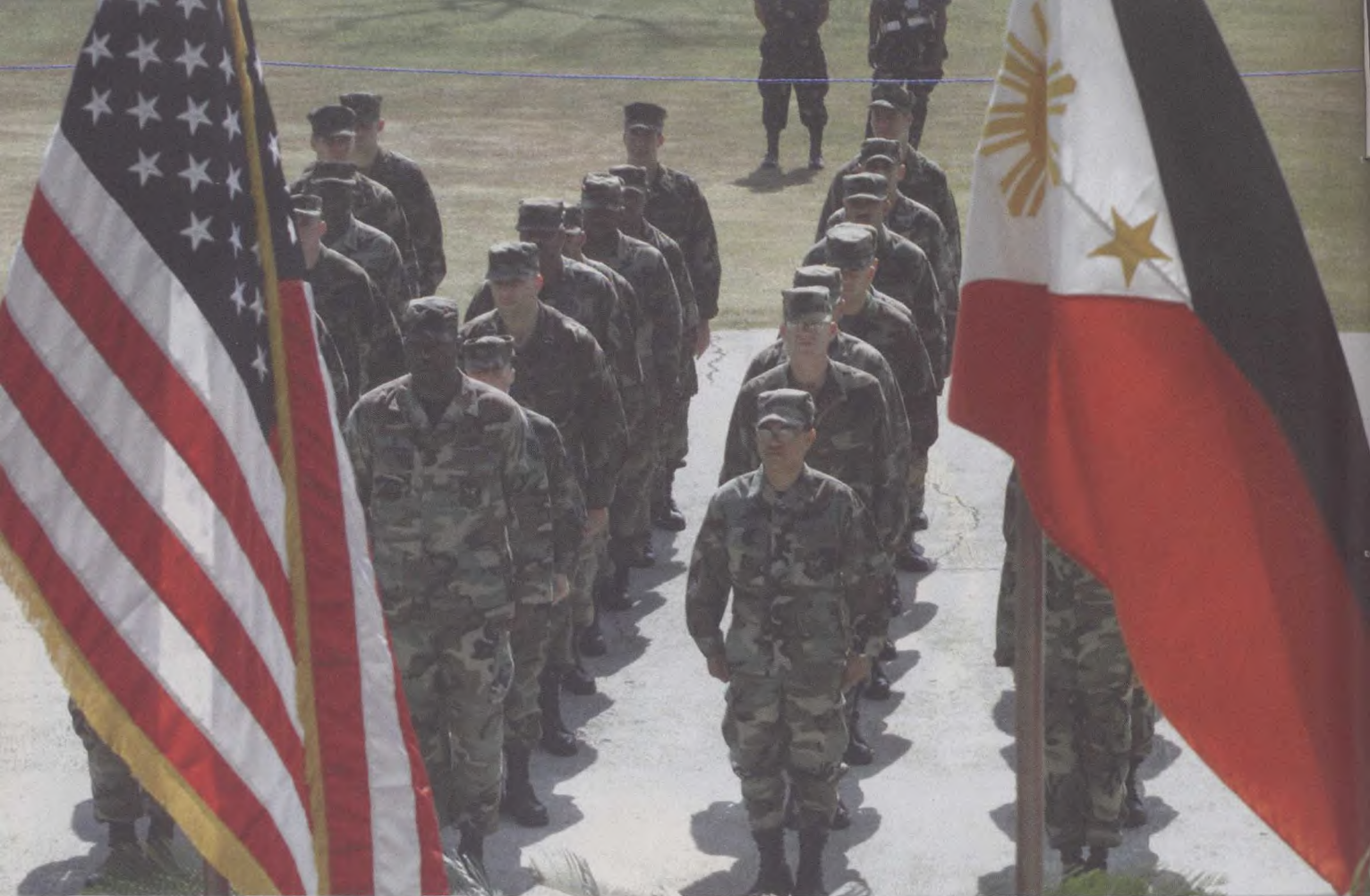
2月初，菲美开始联合军事演习

达一举拿下。要夺取巴格达和推翻萨达姆政权，至少要有1991年“沙漠风暴”行动的兵力，即大约17万士兵。