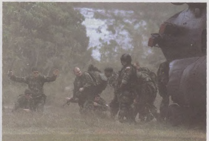
美国士兵乘坐直升机降落在菲律宾巴西兰省首府伊莎贝拉附近的第103旅总部。

美国计划分别向伊拉克北部和南部各派遣5万名士兵,同一时间攻打巴格达。但战略家怀疑即使是这么庞大的兵力,也未必能将巴格