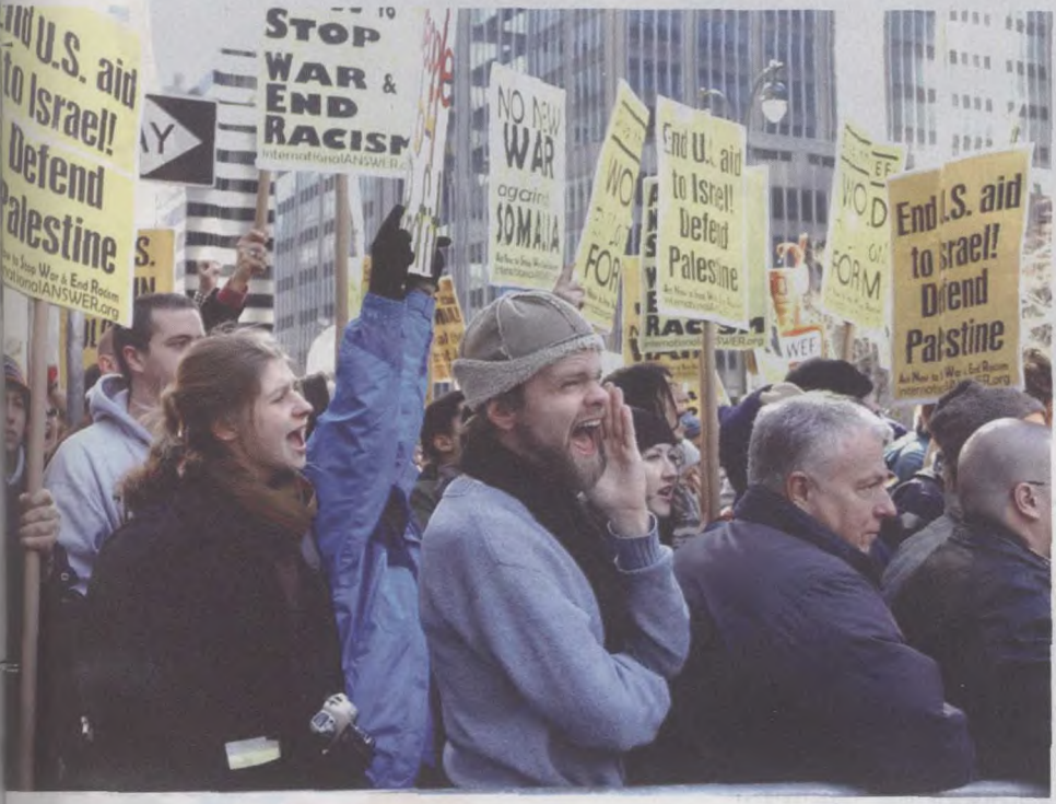
美国的反战示威者在游行中呼喊口号。

是“对美国自由和民主的攻击，是对全人类的攻击”。从恐怖活动本身来说，的确如此，但美国是否认真反思过，怎样才能杜绝此起彼伏、专门针对美国的恐怖活动呢？