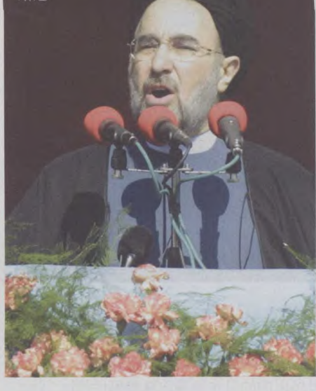
2月11日,伊朗总统哈塔米强烈谴责美国总统布什关于伊朗、伊拉克和朝鲜是威胁世界和平的“邪恶轴心”的指控。

据中东媒体披露,美政府已决定对伊拉克采取军事行动,并制订了对伊行动计划。美国要员频频出访中东,