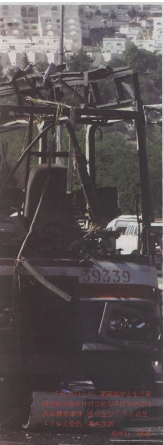
6月18日上午，耶路撒冷发生巴勒斯坦激进组织针对以色列平民的自杀性汽车爆炸事件，造成至少17人丧生，40余人受伤，事件负责。

很少视察爆炸现场的以色列总理沙龙此次也破例赶到事发现场。沙龙表示，这起针对以色列平民的恶性袭击事件是巴勒斯坦“恐怖活动的延续”，以色列对此绝不姑息，必将予以严厉报复。据报道，沙龙于18日召开内阁紧急会议，讨