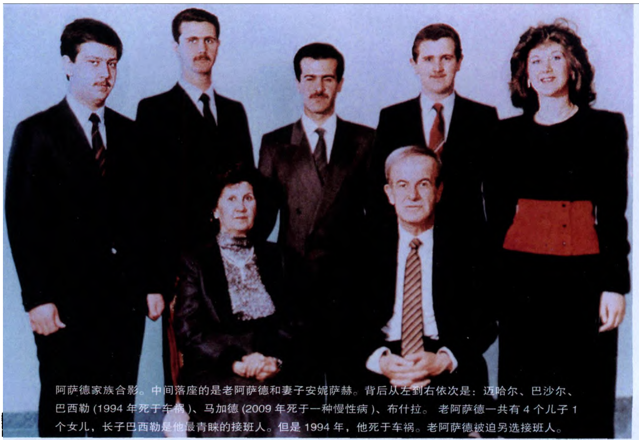
阿萨德家族合影。中间落座的是老阿萨德和妻子安妮萨赫。背后从左到右依次是：迈哈尔、巴沙尔、巴西勒（1994年死于车祸）、马加德（2009年死于一种慢性病）、布什拉。老阿萨德一共有4个儿子1个女儿，长子巴西勒是他最青睐的接班人。但是1994年，他死于车祸。老阿萨德被迫另选接班人。

中国有句俗话叫“成者为王败者为寇”，在世界多个地区情况亦是如此。在胜利者们手握拼着性命打下来的江山的同时，如何才能体现“成者为王”的优越和特权？答案是“家天下”，即把王位世袭给儿子，儿子世袭给孙子，子子孙孙无穷尽也，便可永保天下不落旁人之手。有传位成功者，如叙利亚的老阿萨德，有传位失败者，如埃及穆巴拉克，也有另辟蹊径者，如古巴卡斯特罗，将领导权交给兄弟而不是儿子。公平受到破坏，阶层和财富流动的通道被堵死，世袭制下的家天下很容易引发的特权腐败等问题。在互联网大潮席卷全球每个角落的时代，子承父业这种封建世袭色彩浓厚的、与现代价值观念相违背的老一套作法，显然已经几乎没有市场可言，王者们固执己见的后果就是“水能载舟亦能覆舟”。