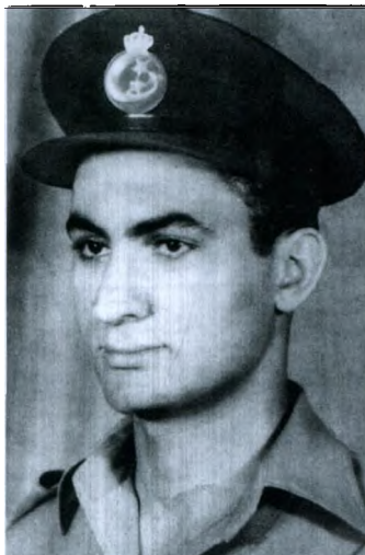
穆巴拉克在埃及皇家空军服役时拍摄的照片。