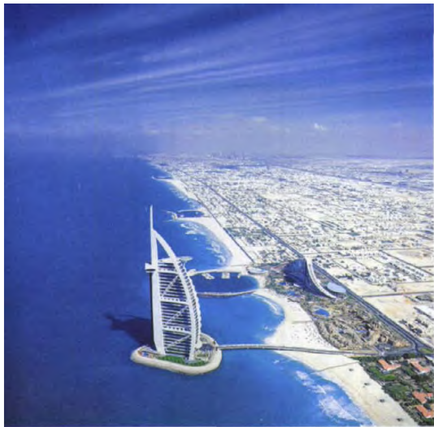
世界上惟一的七星级酒店——迪拜帆船