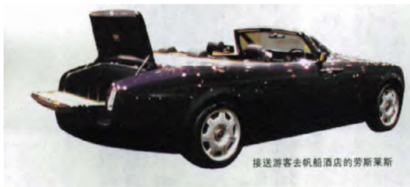
接送游客去帆船酒店的劳斯莱斯

这个石油王国的富有，不仅表现在拥有全球最豪华的酒店、最顶尖的18洞“沙漠高尔夫球场”和面向全世界富豪销售的人造“世界岛”，仅看看当地人享有的社会福利，就够令人咋舌的。阿联酋男人自成年以后，就有相当于200多万人民币的50年无息贷款，创业或者花销，做什么都可以。迪拜本地人每月还享受着近4万元人民币的福利待遇，即使什么都不做，也能过上衣食无忧的生活。但不劳而获靠政府养着的懒人却极少，因为迪拜人觉得，最让他们感到自豪的事，莫过于向自己的国家纳税。