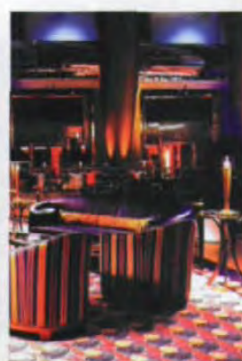
酒店内部金碧辉煌

去，那是在已经深沉的暮色中，一望无际的阿拉伯海。再回头看看这金灿灿的房间，好像进入了童话中的梦幻城堡。