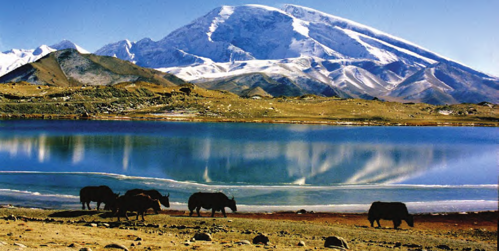
▲“冰山之父”慕士塔格峰