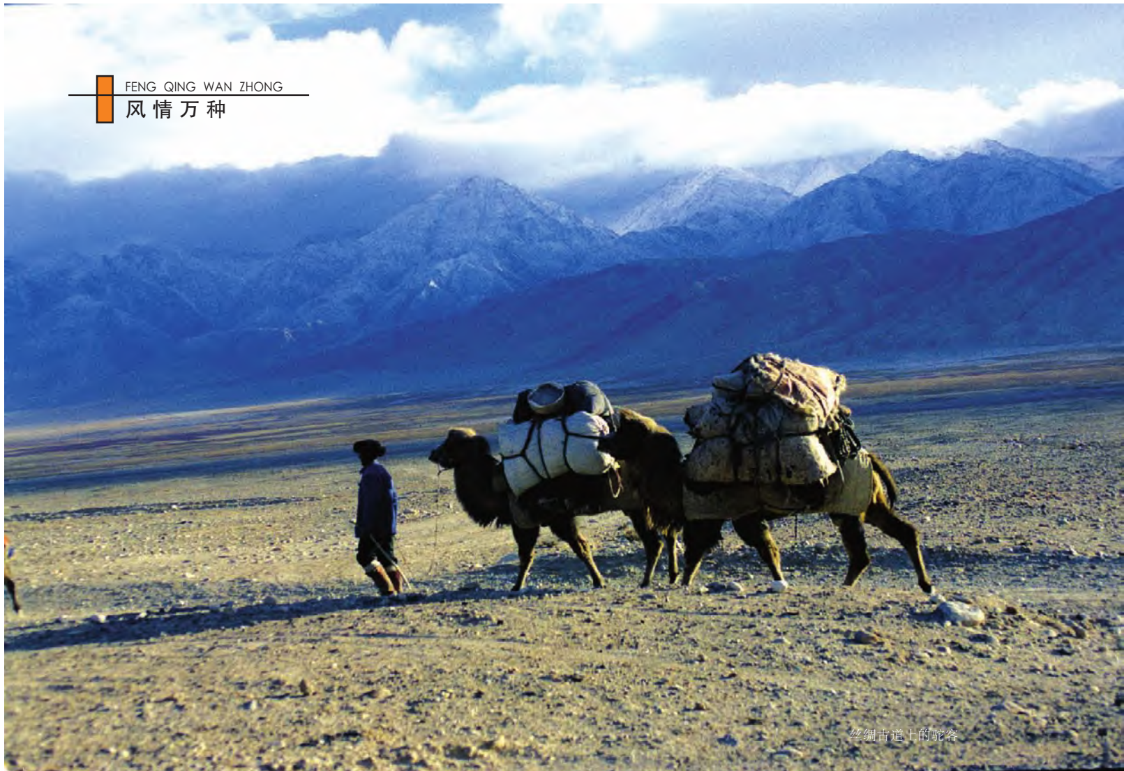
丝绸古道上的驼客