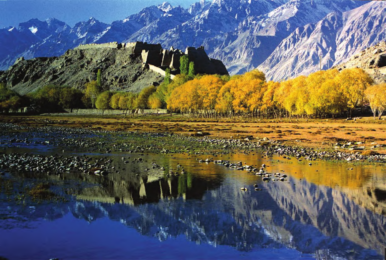
坐落于县城北郊的石头城古堡

帕米尔高原素有“世界屋脊”之称，塔吉克人就居住在帕米尔高原的东部，也就是新疆的西南部。其西北与塔吉克斯坦接壤，西南通过瓦罕走廊与阿富汗相望，南与巴基斯坦相邻。帕米尔高原南有世界第二高峰喀喇昆仑山，海拔8611米；北有著名的“冰山之父”慕士塔格峰，海拔7546米。塔吉克人生存的山间谷地海拔一般也在3000~5000米。这些地区高山终年积雪，有数十条冰川平均积雪厚度达300米左右，夏季冰雪消融，汇流成河，奔泻