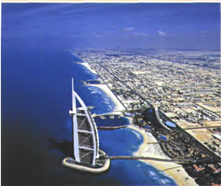
BURJ AL ARAB 大酒店与棕榈岛，近几年迪拜投入大量资金填海“制造”旅游景点。