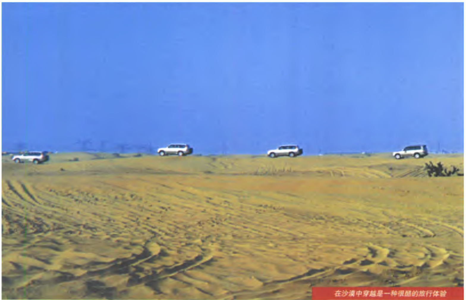
在沙漠中穿越是一种很酷的旅游体验