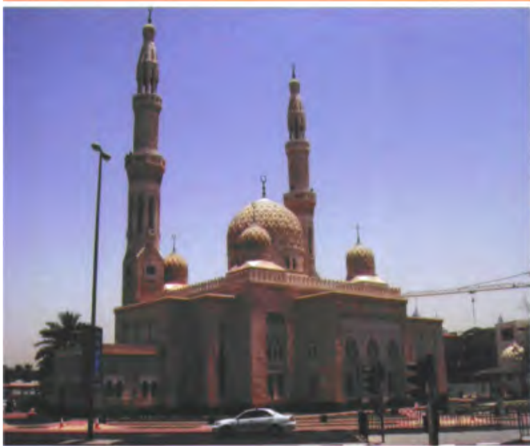
迪拜是建筑师的天堂,在这里能同时看到阿拉伯风情与各种前卫风格的建筑。