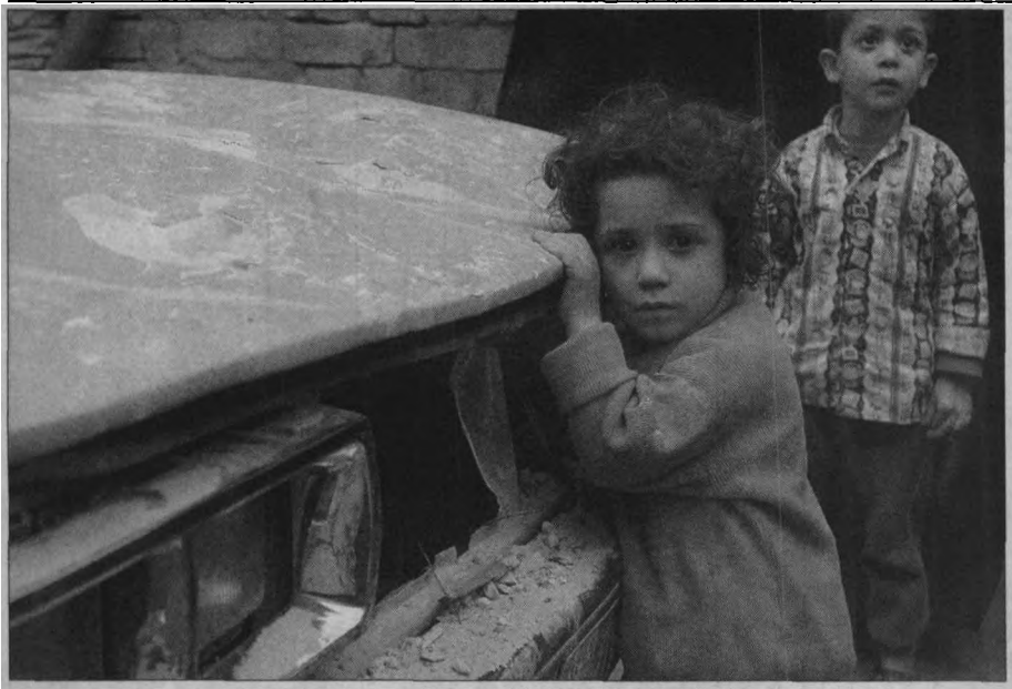
2003年3月24日，在英新一轮空袭过后，滞留伊拉克儿童的是更加破碎的童年

部石油进口的四分之一，而欧盟各国的石油进口则大部分来自海湾。所以，战争所造成的海湾地区石油供应量减少不会对美国造成致命伤害，却必定会对欧洲经济造成窒息，而且时间越长，这种优劣形势的对比就越明显。对即将发生经济窒息的欧盟国家来说，除了拼命就是交枪，美国的胜算也很大。