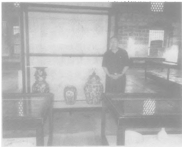
老皇宫托普卡帕宫内陈列的数百件中国元、明、清代的瓷器令人叹为观止

我们在伊斯坦布尔首先参观了托普卡帕宫。这座大奥斯曼帝国的皇宫,如今已是博物馆了。它坐落在外黄金角海湾南岸一个名叫“皇宫鼻”的山顶上。原来这个山顶有座城堡叫托普卡帕(意思