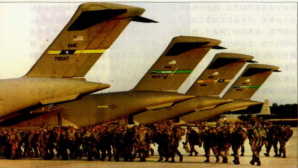
◇ 9月6日，美国军队进行反恐跳伞演习，为即将到来的军事打击做准备。