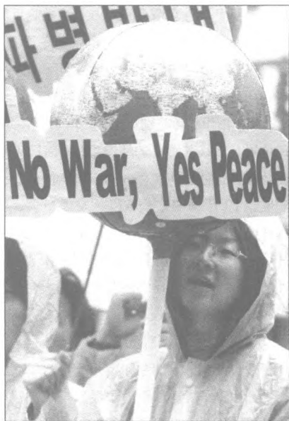
韩国女大学生高举“不要战争，要和平”的标语牌示威游行。

有人曾对世界各国政府、专家、学者对恐怖主义所下的定义作了一个统计，截止到 1999 年，共有 108 种。我国的研究者提出，只要是“为达到某种政治目的，对第三者使用或威胁使用暴力”的行为，就属于恐怖主义的范畴。这里有三个要素：第一是目的，必须是政治的，