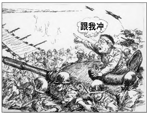
四次中东大战悲壮惨烈。

第一次中东战争（又称巴勒斯坦战争）。1948年5月14日以色列建国。翌日，埃及、约旦、叙利亚、黎巴嫩和伊拉克军队联合向其发起进攻。在全世界犹太人的帮助下，以军最终取得战争胜利。战后，以不仅夺回了联合国“分治”决议划归它的领土，而且