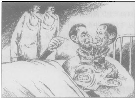
内贾德与查韦斯——布什的两颗“眼中钉”。 云川水 画

和厄瓜多尔三国，在美国的“后院”四处活动，寻找盟友、扩大影响。内贾德和委内瑞拉总统查韦斯决定，两国将斥资20亿美元，设立“反美基金”，帮助一些国家摆脱美国的控制。这顿使华盛顿感到如鲠在喉。