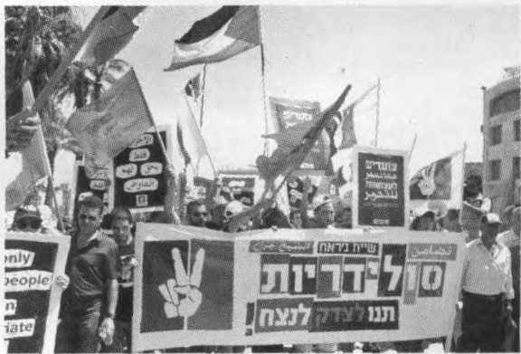
2011年7月15日，耶路撒冷数千人游行支持巴勒斯坦建国。

此番巴勒斯坦坚持提出“入联”申请，决意和两只“拦路虎”干到底，的确是“箭在弦上不得不发”。首先是因为巴以和谈的长期停滞，使巴民族权力机构面临着极大的压力。