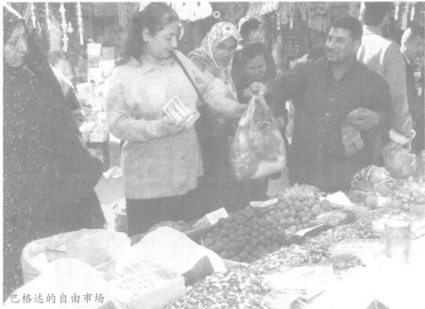
巴格达的自由市场

如今,萨达姆打着“泛阿拉伯主义”的旗帜,将美国为首的多国部队比作西方的“新十字军”,而他则自誉为抗击“新十字军”的现代萨拉丁。从思想意识方面