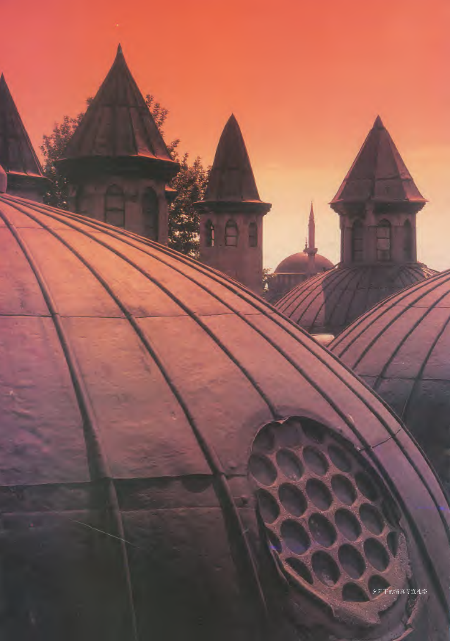
夕阳下的清真寺宣礼塔