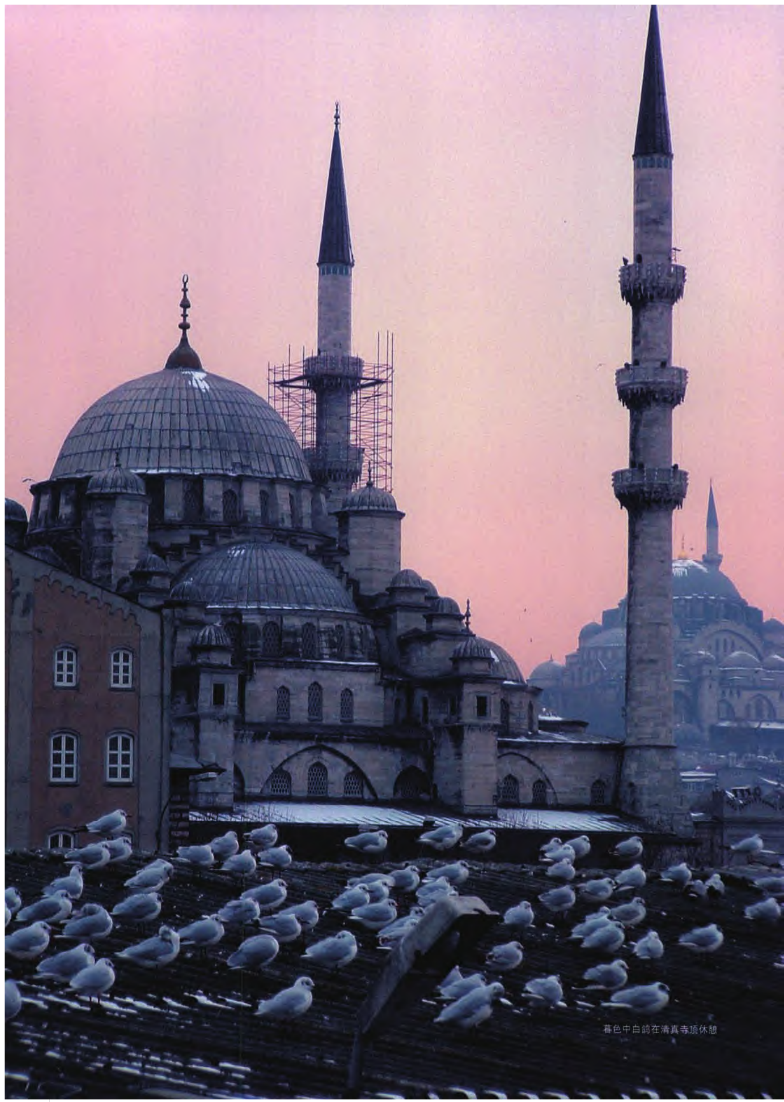
暮色中白鸽在清真寺顶休憩