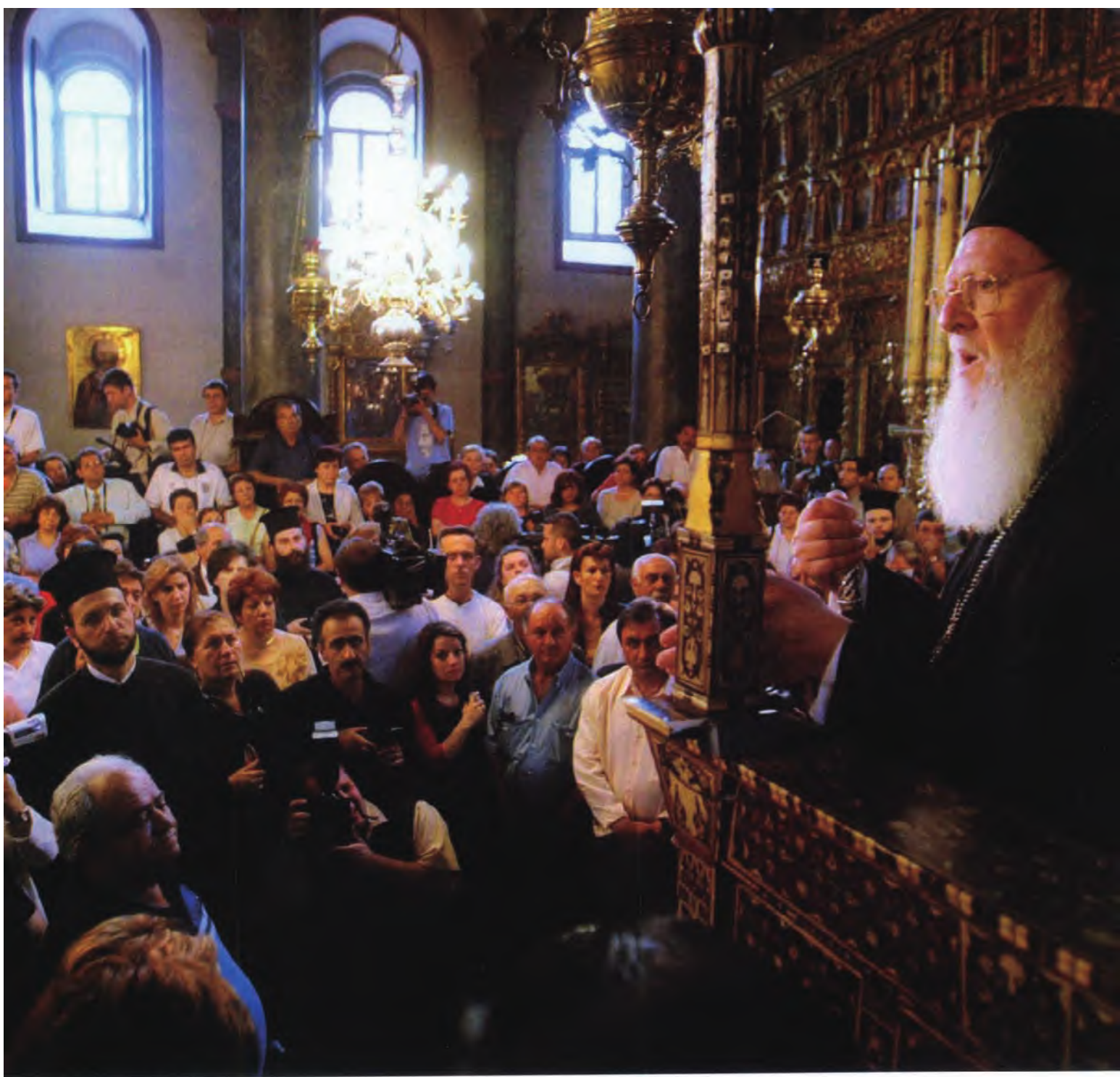
圣索菲亚大教堂内讲经

庞，那一刻，仿佛听到天使在歌唱，内心如同经历了洗涤般纯净平和。教堂墙壁上显眼的地方悬挂着6个直径约10米的大圆盘，绘以阿拉伯文字的“万物非主，唯有真主”，据说是伊斯兰教先知穆罕默德和他弟子的象征。古老墙壁上模糊的圣像以及伊斯兰风情石柱上精美的雕刻在无声地诉说着历史上基督教和伊斯兰教的战争。而如今，两者奇迹般地融为一体，向后世昭示着这一宗教圣地历经易主、饱经风霜的过去。环顾一周，左边过道上一根矩形大理石石柱旁有一个拇指大小的洞，人们将拇指塞在里面，并费力地旋转，据说将大拇指插入潮湿的石洞，并以平面