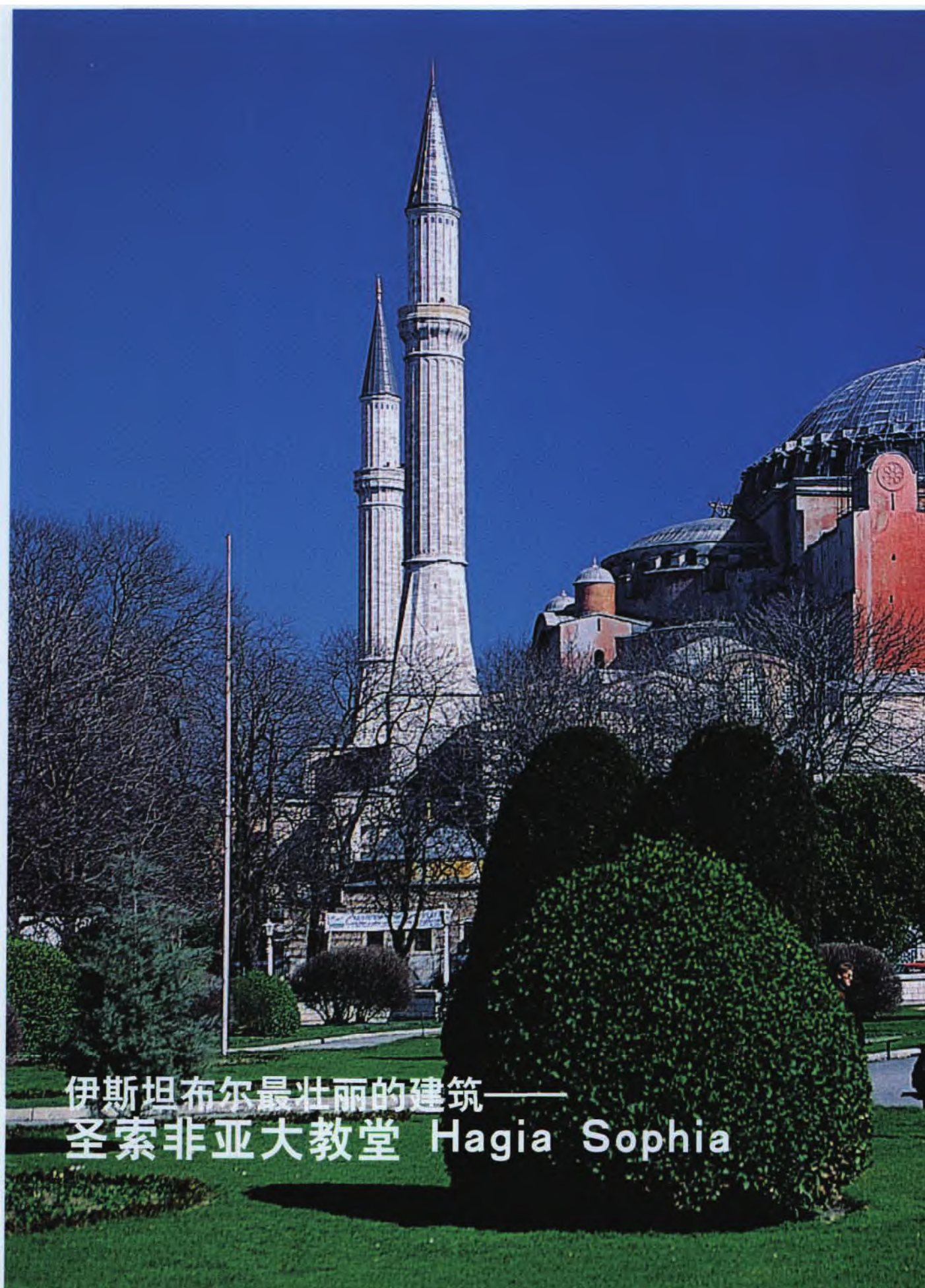
伊斯坦布尔最壮丽的建筑—— 圣索非亚大教堂 Hagia Sophia