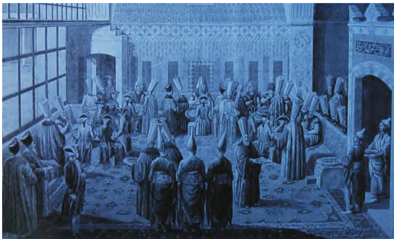
议政堂里欢宴欧洲使节