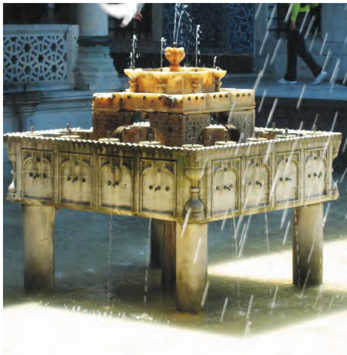
托普卡珀宫喷水池