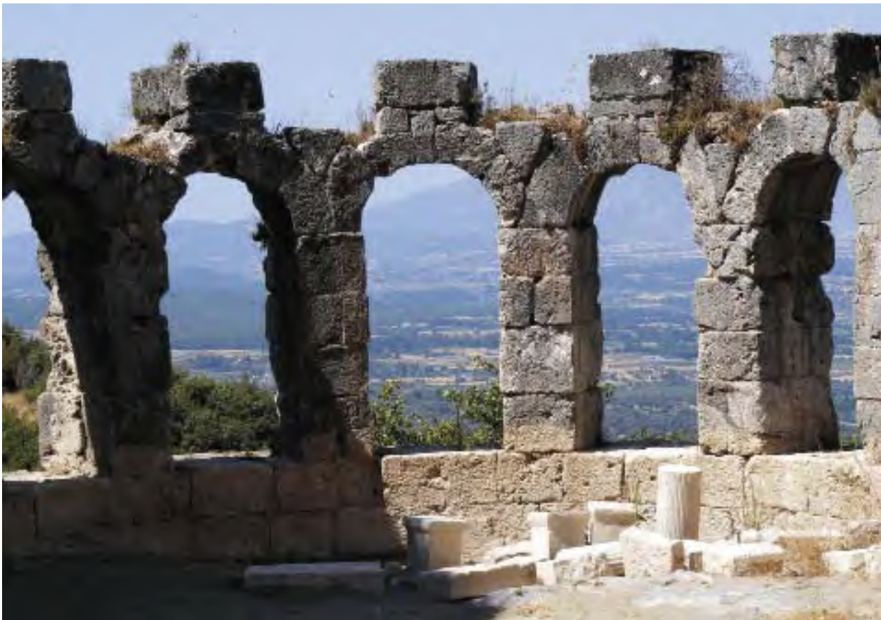
从古罗马浴室远眺桑索斯峡谷。