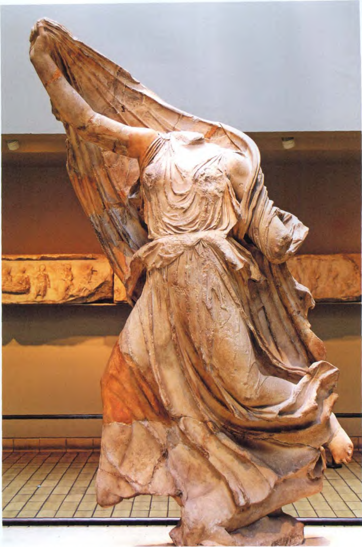
桑索斯出土的海洋女神涅瑞伊德雕像，现收藏于大英博物馆。