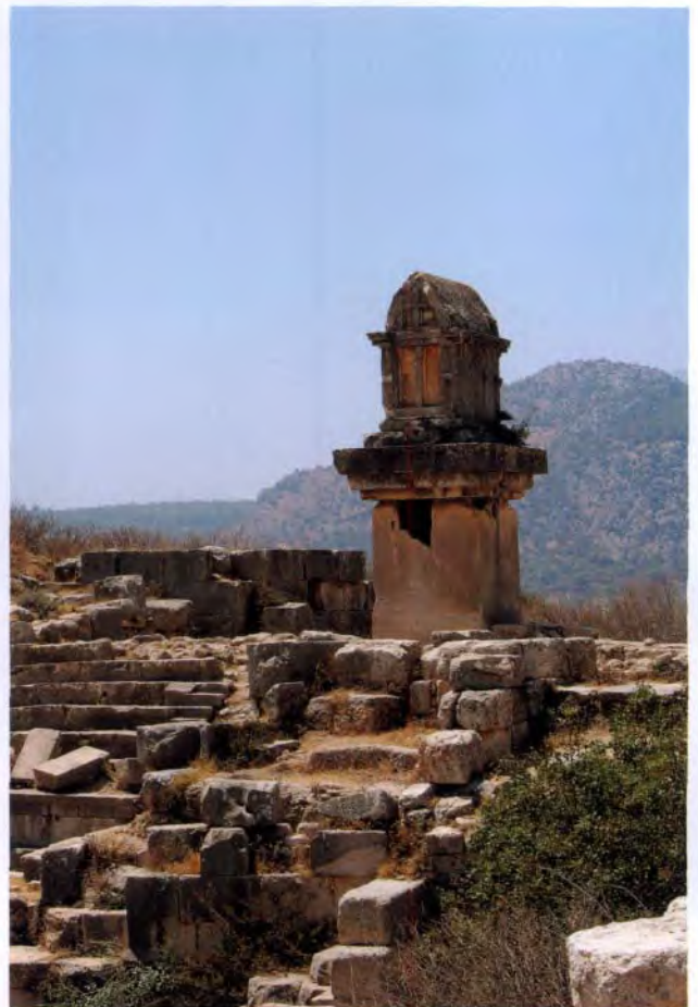
遗址中高置的利西亚墓葬建筑物