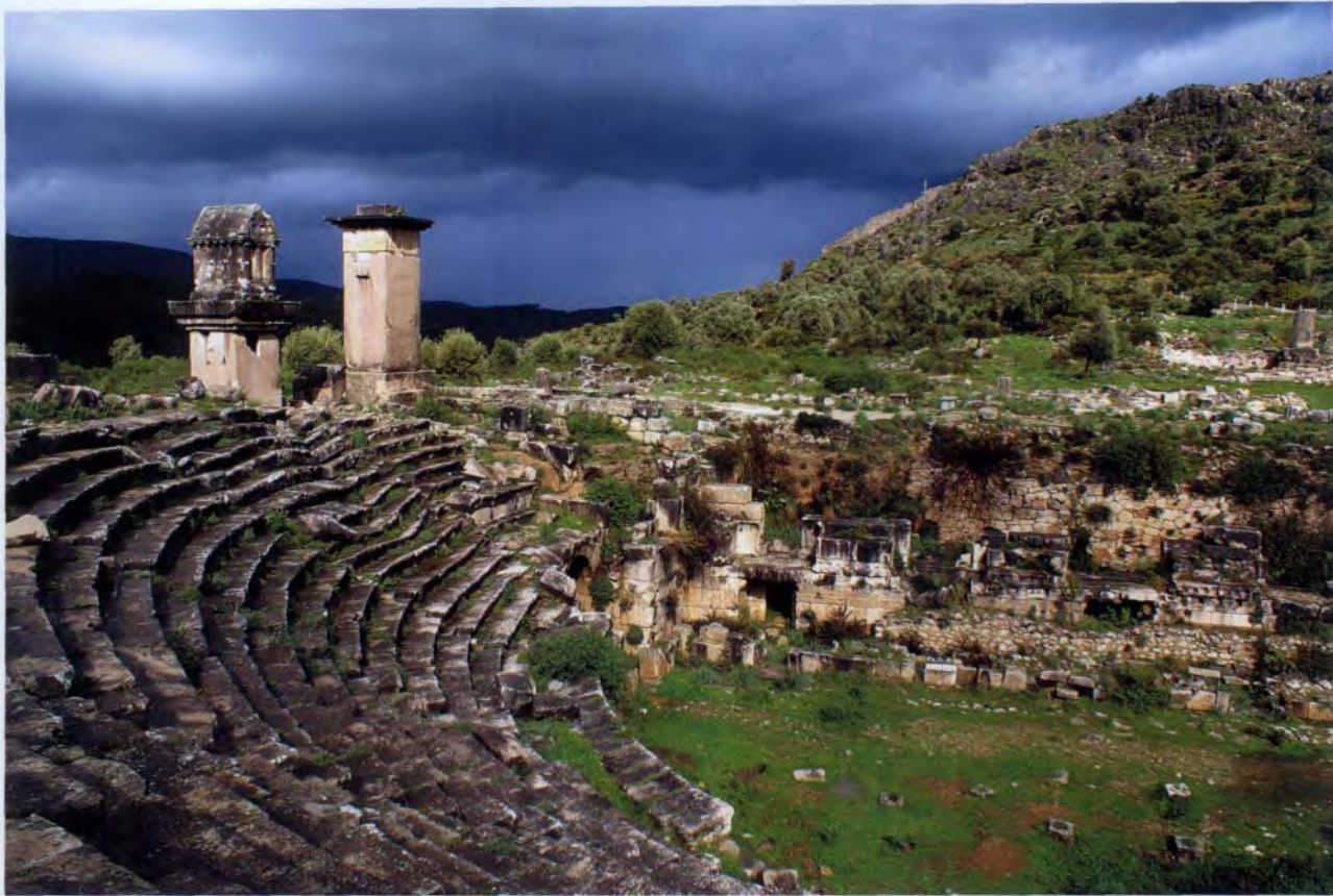
桑索斯古剧场遗址与纪念碑