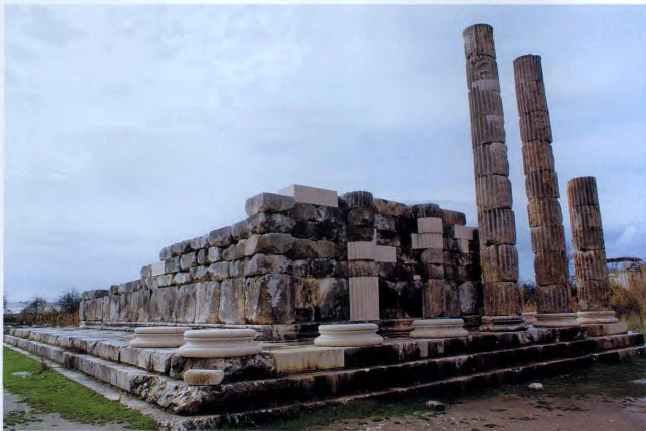
莱顿神殿遗址

莱顿的考古遗址供奉勒托、阿耳忒弥斯、阿波罗（勒托是古希腊神话中宙斯的情人，阿耳忒弥斯和阿波罗是她的一对孪生女儿）。除神庙废墟以外，还包含古罗马皇帝哈德良时代的女神庙遗址，建在庇护所的起源地。希腊和