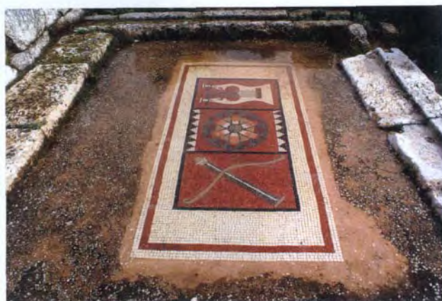
莱顿神庙遗址中发掘出的马赛克图案。

向南延伸至维斯帕先（古罗马皇帝）拱门，向北延伸至希腊卫城。此系该城低洼部分所在的位置，仅有一部分进行了挖掘。若干大型的建筑联合体被确认为是希腊式广场和两座拜占庭式教堂。