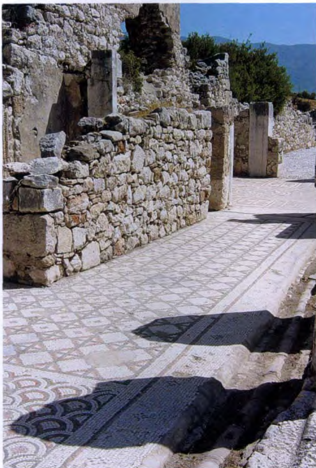
桑索斯遗址地面的马赛克装饰