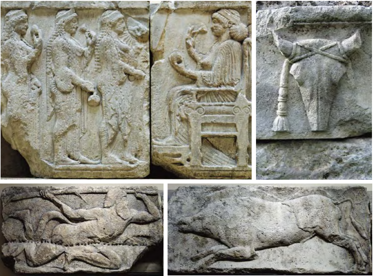
桑索斯遗址出土的古利西亚人的巨幅石雕。

言保留了很长久的时间。时至今日，该地区的农夫所建的木屋和粮仓在结构上仍然与利西亚的岩石艺术坟墓可有一比。其二，他们的文化适应能力极强。这种能力使他们能够依次吸收由爱琴海的希腊殖民地传播来的古希腊文化，以及后来的罗马文化。公元3世纪罗马人在此重修了集会所，里面仍然供奉着利西亚的12位神祇，就是罗马文化存在于此的证明。