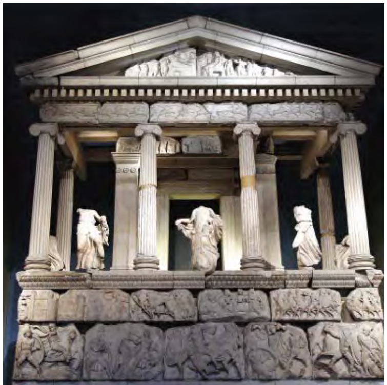
大英博物馆展出的重建的海神纪念碑。