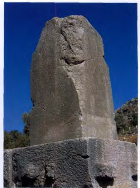
刻在岩石上的碑文是研究印欧语言和利西亚人历史的重要资料。

利西亚人在漫长的历史中展示了两种截然相反的民族特点。其一，他们极端忠实于自己的传统。利西亚人的语