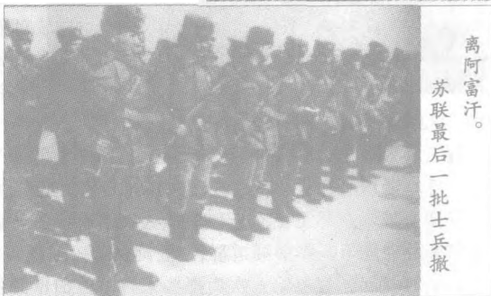
离阿富汗。 苏联最后一批士兵撤离

联入侵阿富汗战争,当时苏联也是超级大国,但也被阿富汗打败。阿富汗说他们正准备第三次打赢同美国超级大国的战争,让美国陷入阿富汗泥潭中。