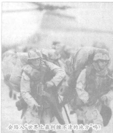
会陷入“世界上最纠缠不清的地方”吗?

手并不在于时间和部署能力,而在于有没有目标,在于能不能找到确实的情报。拉登现在从某种意义上说就是一个符号,许多针对美国的袭击者都自称是拉登。