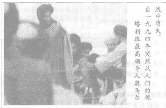
线中消失。 自一九九四年突然从人们的视线中消失。 塔利班最高领导人奥马尔

讲也是一个危险的挑战,美国发出这种信号后,许多媒体认为塔利班已穷途末路。在我看来,现实也许会和美国开玩笑。我认为如果没有美国介入,塔利班也许有一天会倒台,但是美国一旦将其作为敌人,反而会使塔利班浴火重生,政权得以巩固。阿富汗民族是一个典型的山地民族,阿富汗的民族特性就是在有外敌压力时,他们最有民族凝聚力,一致对外。阿富汗人讲,如果你是朋友,我可以为你赴汤蹈火,如果你是敌人,我们会斗争到底,直到流尽最后一滴血。所以我们不难理解,当美国将目标锁定阿富汗时,北方联盟说要与塔利班联手共同抗击美国。1994年塔利班出现在阿富汗不是偶然的,短短两年塔利班占领首都,到1998年就控制了全国90%多的领土,在很大程度上确实得到了老百姓的支持。历经磨难,老百姓渴望和平,塔利班带给了老百姓相对稳定的生存环境。但是近两年,由于北方联盟有外力支持,塔利班无法消灭它,同时又突破不了国际制裁,塔利班在老百姓心目中的威信已大打折扣,塔利班的处境十分艰难,其支持率在下降,国内不时有些反叛活动。恰在这时,塔利班成了美国的敌人。面对美国这样的大敌,塔利班也许会重获新生。