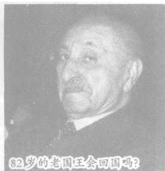
82岁的老国王会回国吗?