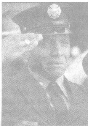
“9.11事件”是一剂清醒剂。

在这个意义上说,美国对恐怖主义的军事战争,只治标不治本。而且,这也是一场巨人与影子的战争。美国看不到产生恐怖主义的大部分根源在于它自身的对外政策中的霸权主义、强权政治以及自己的资本主义文明的扩张,因此它不会明白为什么它这个巨人越大,它的影子也越大。▲