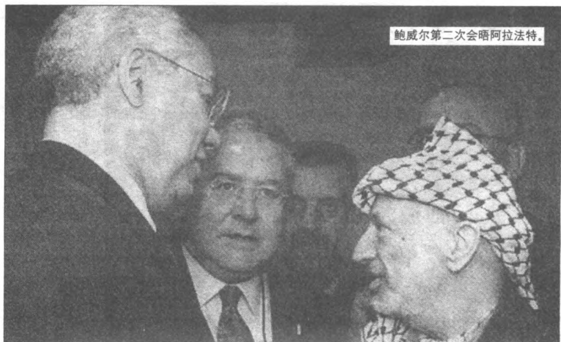
鲍威尔第二次会晤阿拉法特。