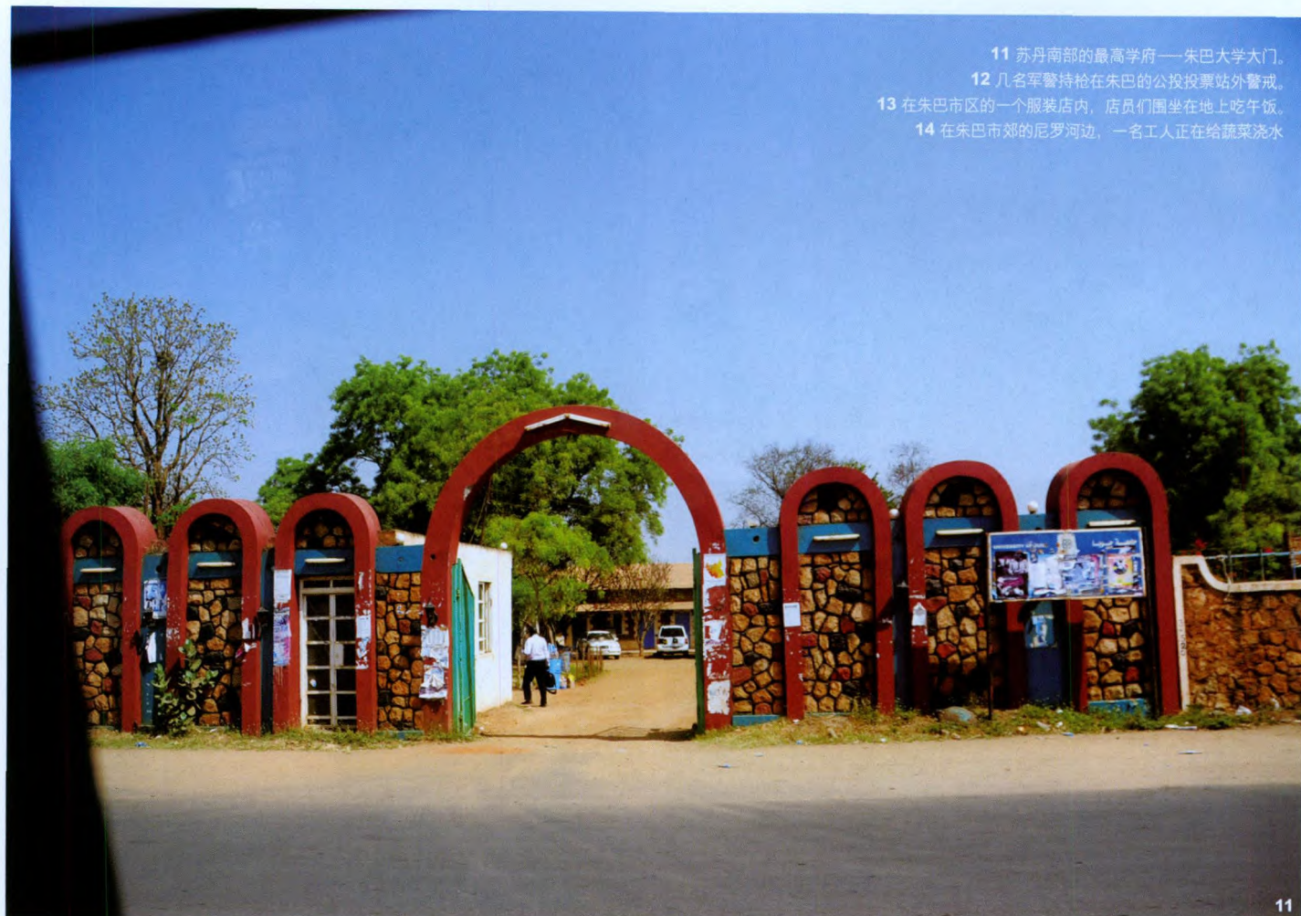
11 苏丹南部的最高学府——朱巴大学大门。