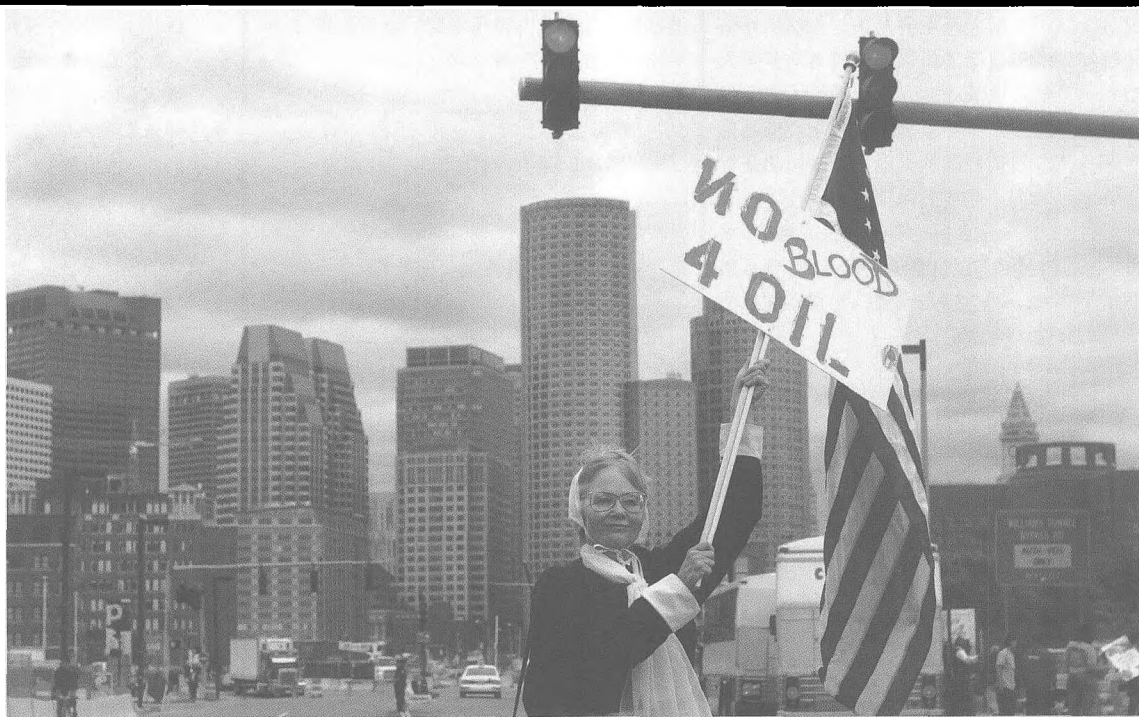
“别为石油流血”。波士顿妇女的抗议反映了美国民众渴求和平的心声。

二战后,美苏对抗的冷战格局逐步形成,第三世界国家彻底摆脱西方控制的要求越来越强烈,民族主义情绪日益高涨。在这种背景下,中东阿拉伯国家为夺回本国石油资源的主权与