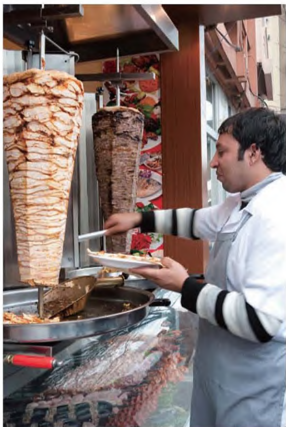
著名的土耳其烤肉

新奇的是他们在船上加工烤制，船摇摇摆摆的在海上漂浮着，买汉堡时可以把钱递给他们，他们从船上把汉堡再递给你。