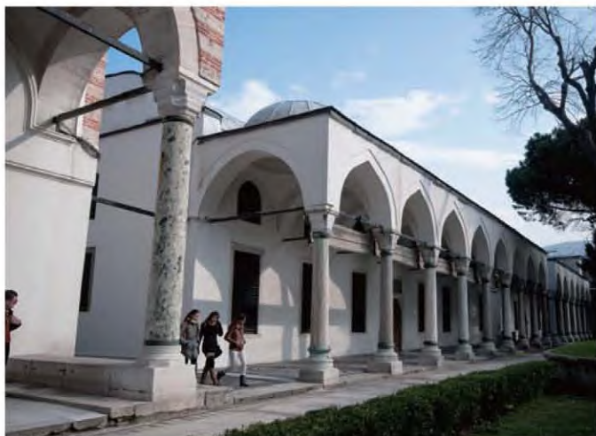
老皇宫内的御膳房