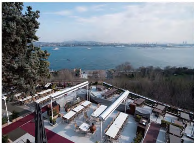
站在老皇宮庭院的頂層，可以看到著名的博斯普魯斯海峽