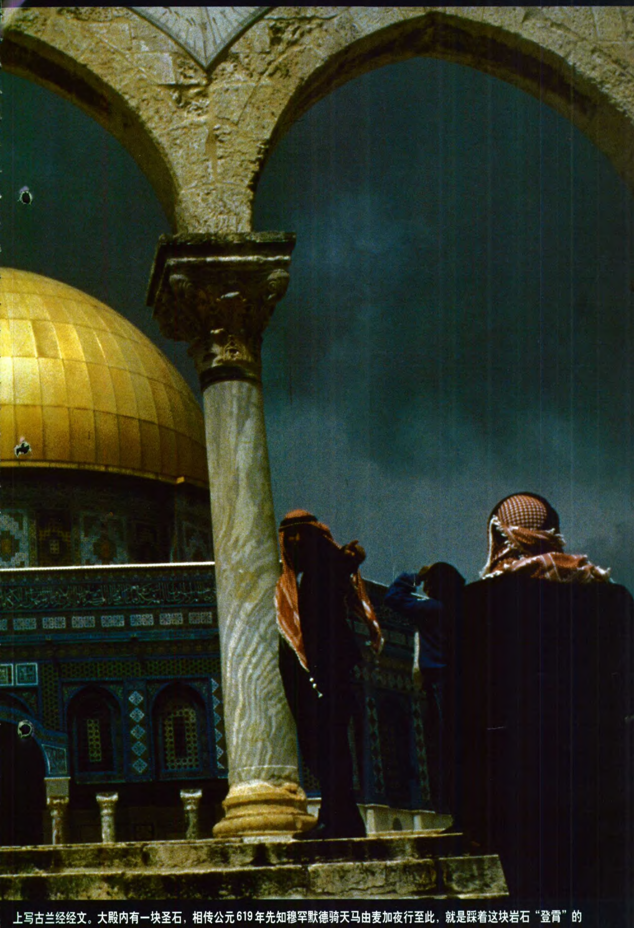
上写古兰经文。大殿内有一块圣石，相传公元619年先知穆罕默德骑天马由麦加夜行至此，就是踩着这块岩石“登霄”的