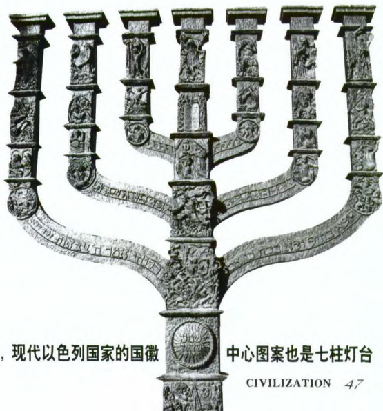
七柱灯台是耶路撒冷犹太圣殿中的圣器,中央的那枝是代表圣安息日,现代以色列国家的国徽

在这次犹太人移民巴勒斯坦的过程中,耶路撒冷作为宗教圣地,吸引了不少犹太定居者。此前的耶路撒冷,是个非常小的市镇,其范围仅限于1542年奥斯曼土耳其帝国修复的城墙内,面积只有约1平方公里,如今这里被称为老城。1856年以后,由于涌入的移民越来越多,犹太人和阿拉伯人开始向城外扩展新的定居点,逐渐形成了以犹太人为主的西区和以阿拉伯人为主的东区。