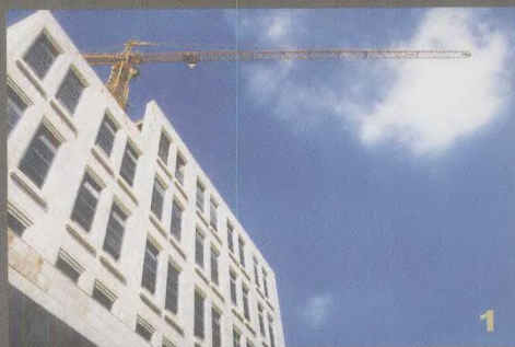
1.耶路撒冷雅法路附近 一处办公楼，中国工人 参与了这座大楼的建设