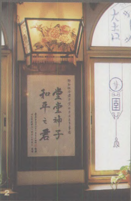
2. 耶路撒冷君子堂中餐馆内悬挂的中文字幅，表达了中国商人对和平的向往和祝愿