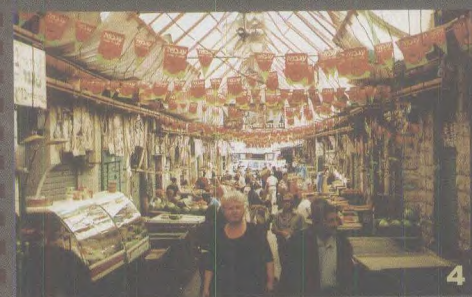
4.耶路撒冷市中心耶胡达市场。这里果蔬新 鲜，价格低廉，吸引不少中国人到此采购