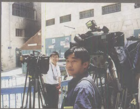
4. 新华社记者蒋国鹏、聂晓阳采访伯利恒圣诞教堂武装对峙。