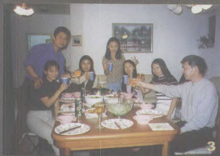
3. 国际台、新华社记者与留学生在一起聚会。