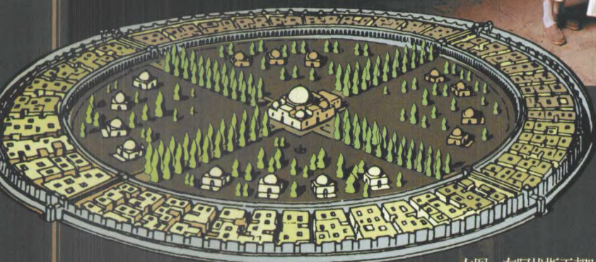
上图：伊拉克的古迹随处可见，它们为后人留下了宝贵的精神财富，也遭受了无尽的灾难

和街头阿里巴巴的女仆美加娜往强盗躲藏的油篓中倒油的雕塑在提醒人们，这里是《一千零一夜》的故乡。