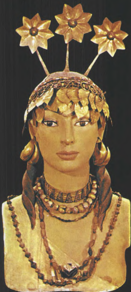
公元前2450年时期，伊拉克地区妇女的典型装饰