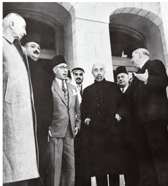
1948年5月10日,约旦首都安曼,约旦国王阿卜杜拉(右三)与叙利亚、黎巴嫩等国代表举行会谈。4天后,以色列建国。约旦、埃及、叙利亚、黎巴嫩及伊拉克随即组成阿拉伯联军,从南、北、东三面围攻以色列

5月22日,埃军行至耶路撒冷南郊,以色列紧急抽调兵力阻止埃军前进。战至当天夜晚,白天激战的尘埃还未散尽,埃军先头部队的后方竟然响起了激烈的枪声,喊杀声在沙漠中回荡,令人不寒而栗。没等埃军指挥官反应过来,前线又传来急报:控制埃军供应线的69高地被以军占领。埃军据此认为遭到以军主力发起的夜