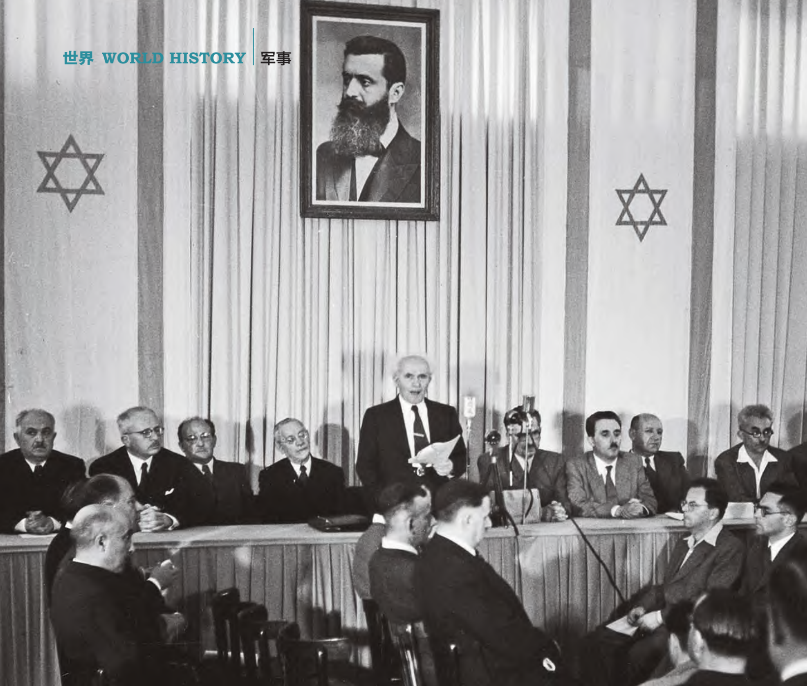
/ 1948年5月14日，以色列“国父”、第一任总理本·古里安(站立者)在特拉维夫发表《独立宣言》，宣告以色列建国。其上悬挂着犹太复国主义先锋西奥多·赫茨尔的照片