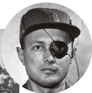
上图 / “独眼将军”摩西·达扬：第一次中东战争期间，达扬担任第八十九突击营任营长，他总是身先士卒，高喊“跟我冲”而不是“给我上”。1949年，34岁的达扬被提拔为少将，成为以色列军队中最年轻的将军